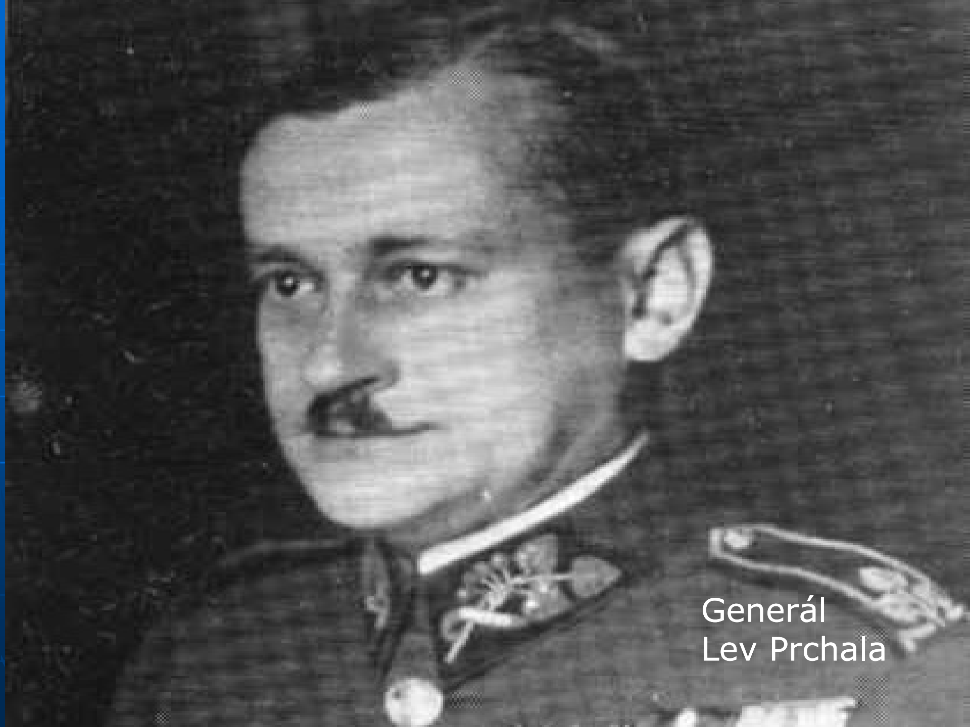
Generál Lev Prchala