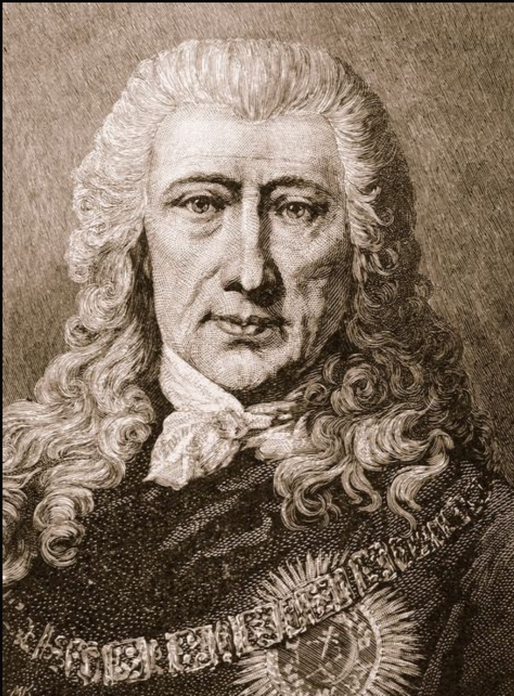
Kníže Václav Antonín Kaunitz (1711-1794)