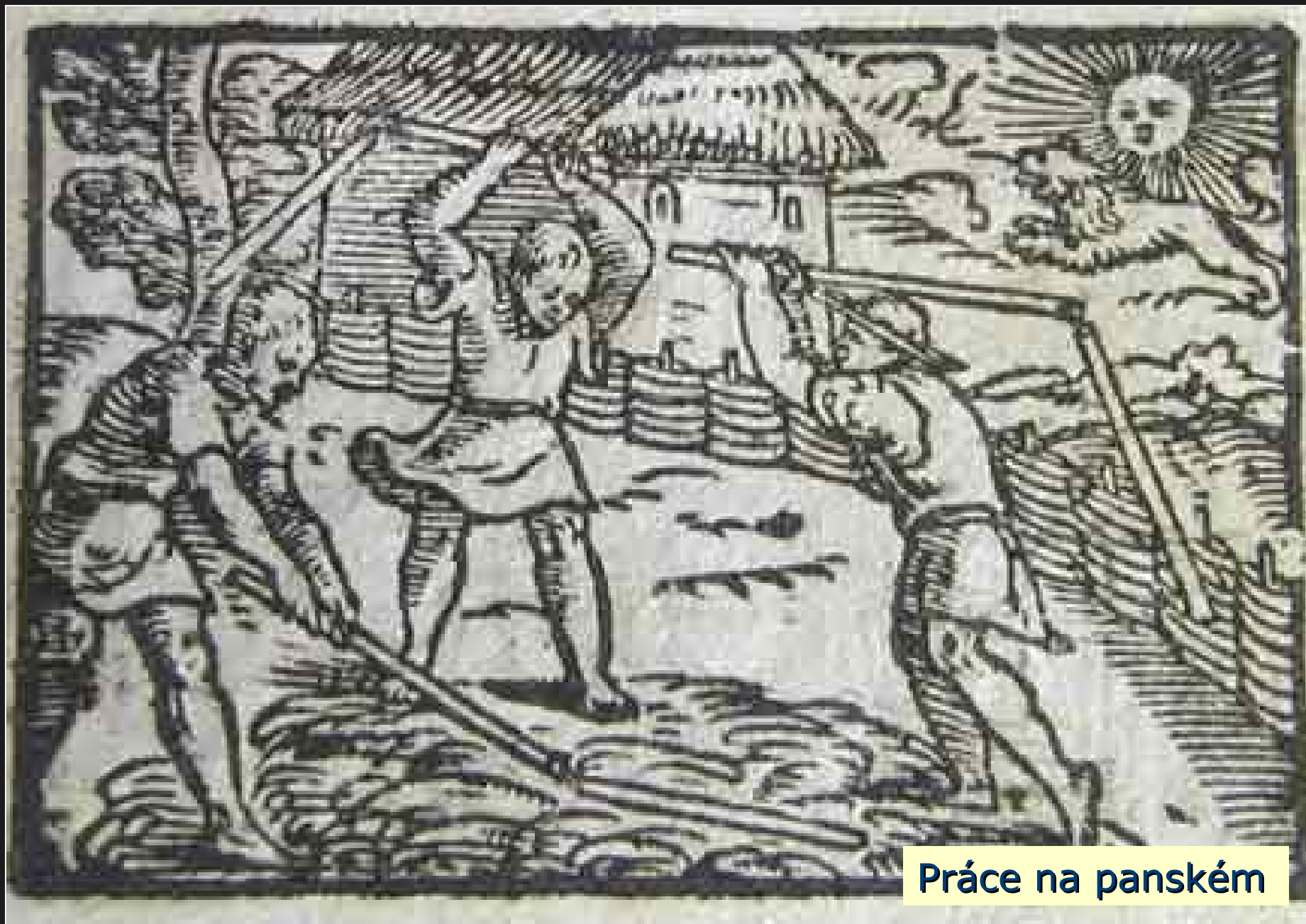
Práce na panském