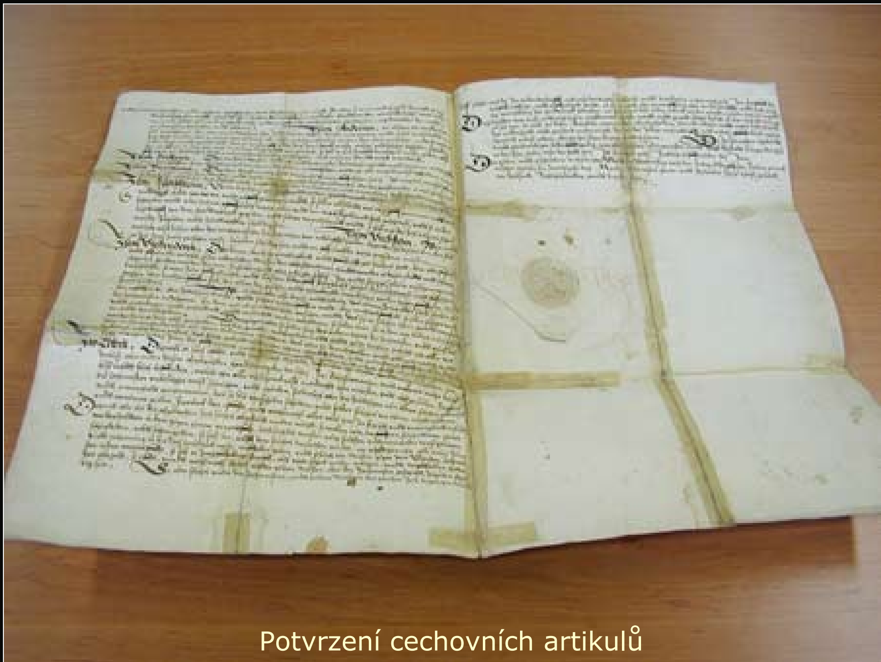
Potvrzení cechovních artikulů