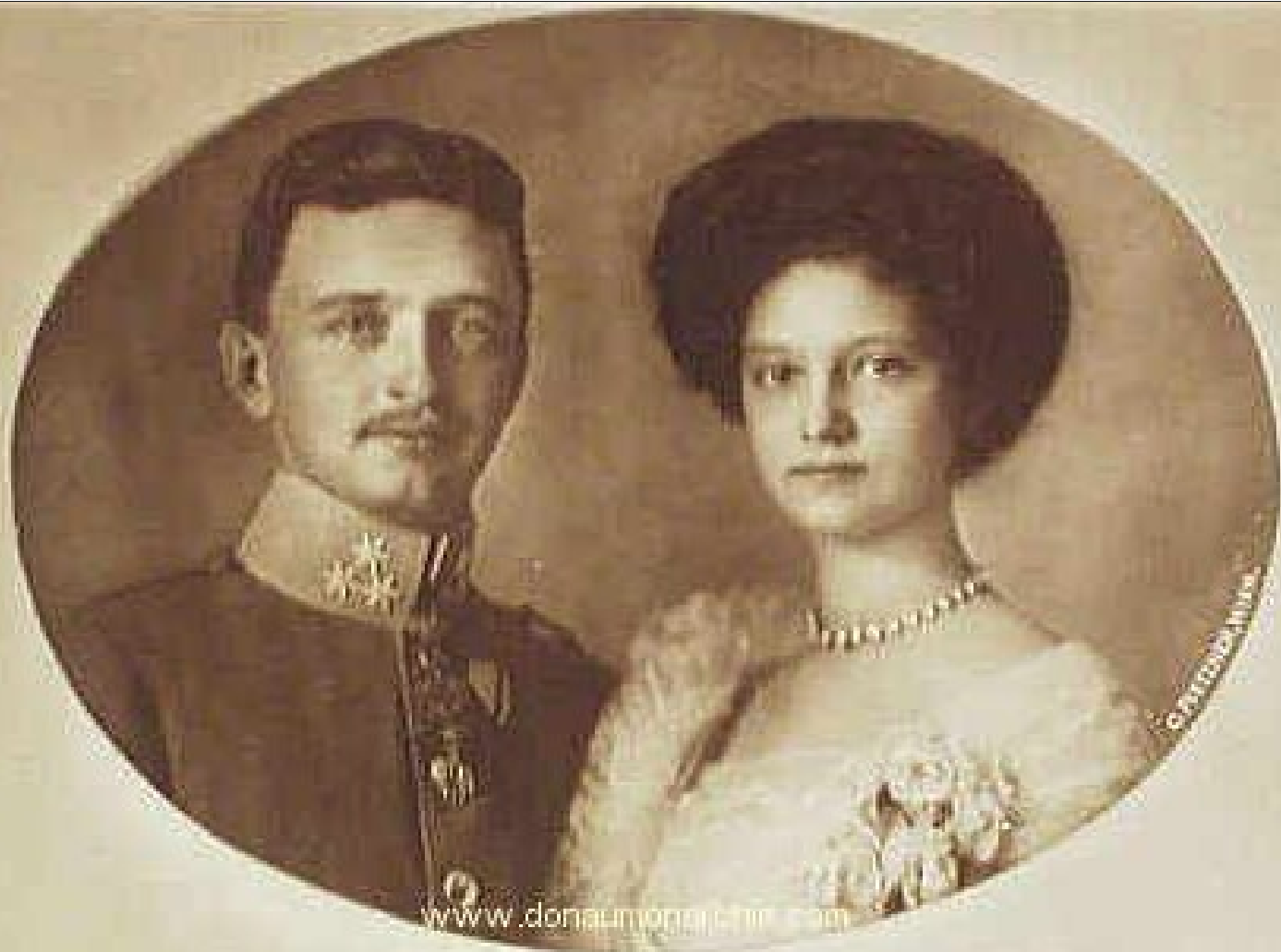
1890 1890 1890 Kaiser Wilhelm Kaiserin Aida