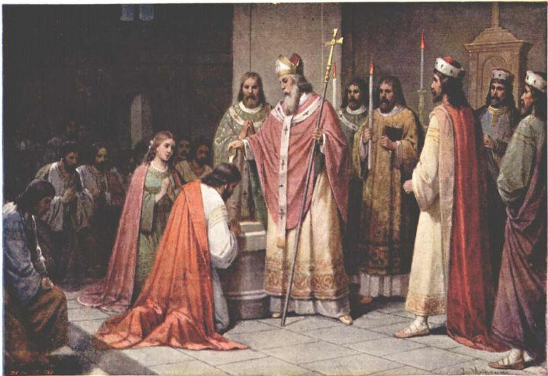
Arcibiskup Methoděj křtí českého knížete Bořivoje a jeho manželku Ludmilu na Velehradě roku 877.