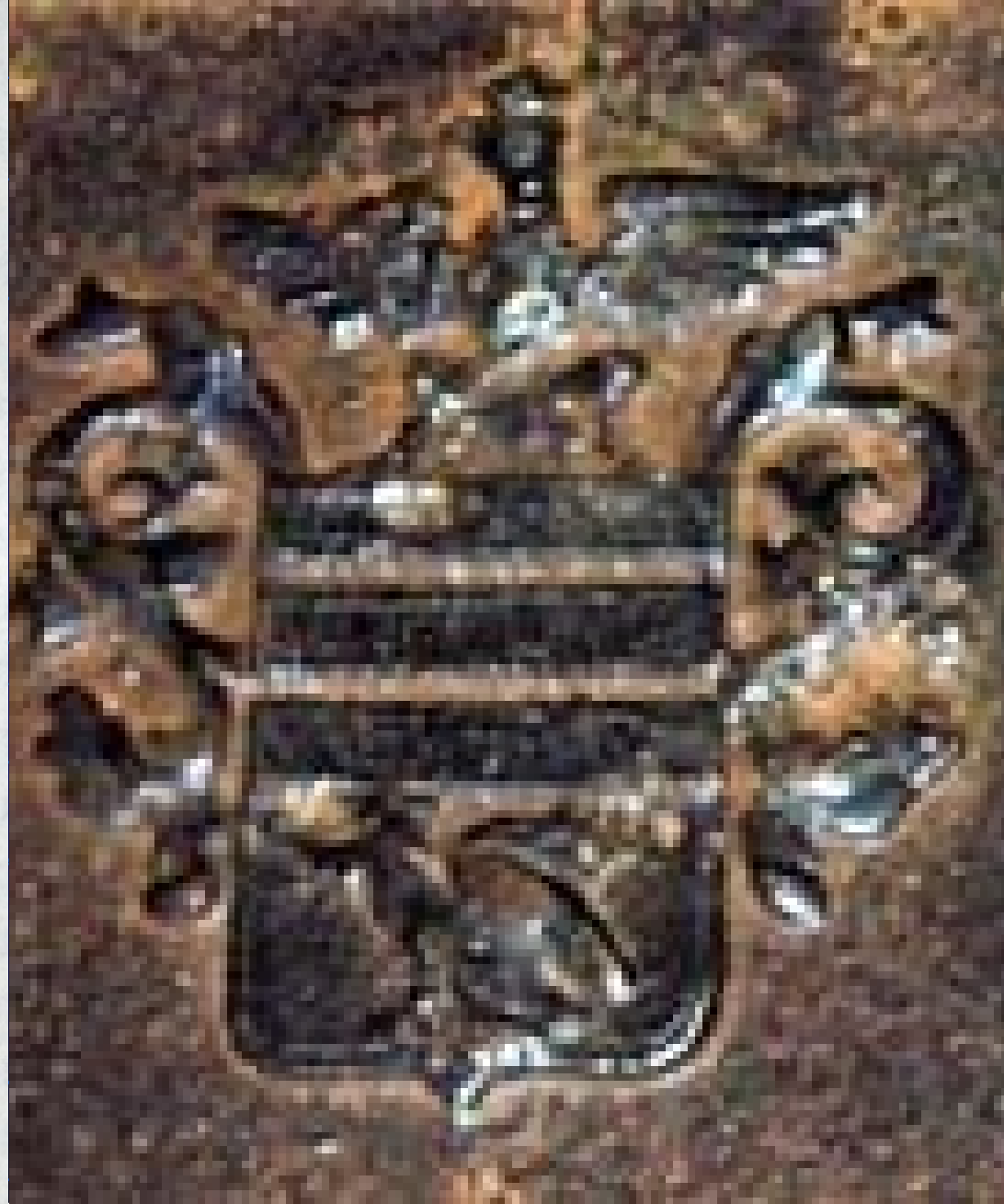
Erby tekovské a abovsko-turňanské župy