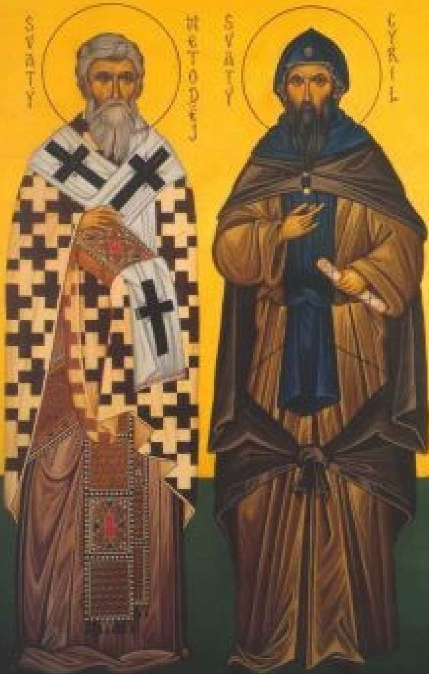
Konstantin a Metoděj