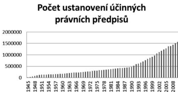
Graf ukazuje enormní nárůst objemu platného práva od roku 1990

Právní řád prošel v průběhu posledních 20 let zásadní proměnou. Jejimi nejvýznamnějšími rysy jsou rapidní nárůst množství právních předpisů, jejich složitosti a vzájemných vazeb, a to jak mezi právními předpisy České republiky navzájem, tak i směrem k právu Evropské unie. Právo České republiky je v tomto ohledu typickým příkladem práva moderní společnosti počátku 21. století, které v sobě nese navíc stopy široké palety často vzájemně protichůdných politických změn. Vzhledem k objemu a počtu právních norem klade na své adresáty a tvůrce poměrně vysoké nároky.