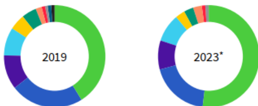
Global eCom payment methods