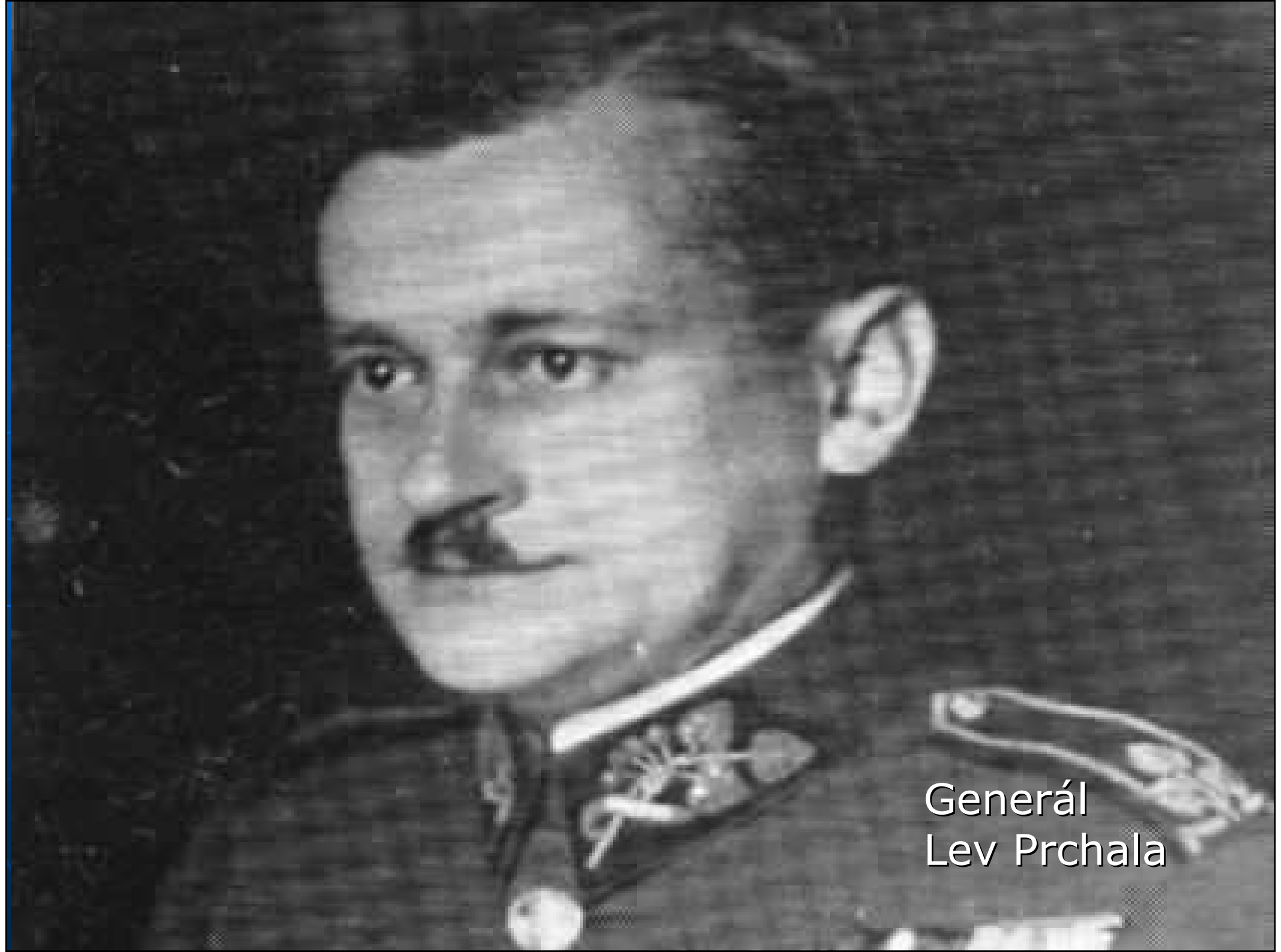
Generál Lev Prchala