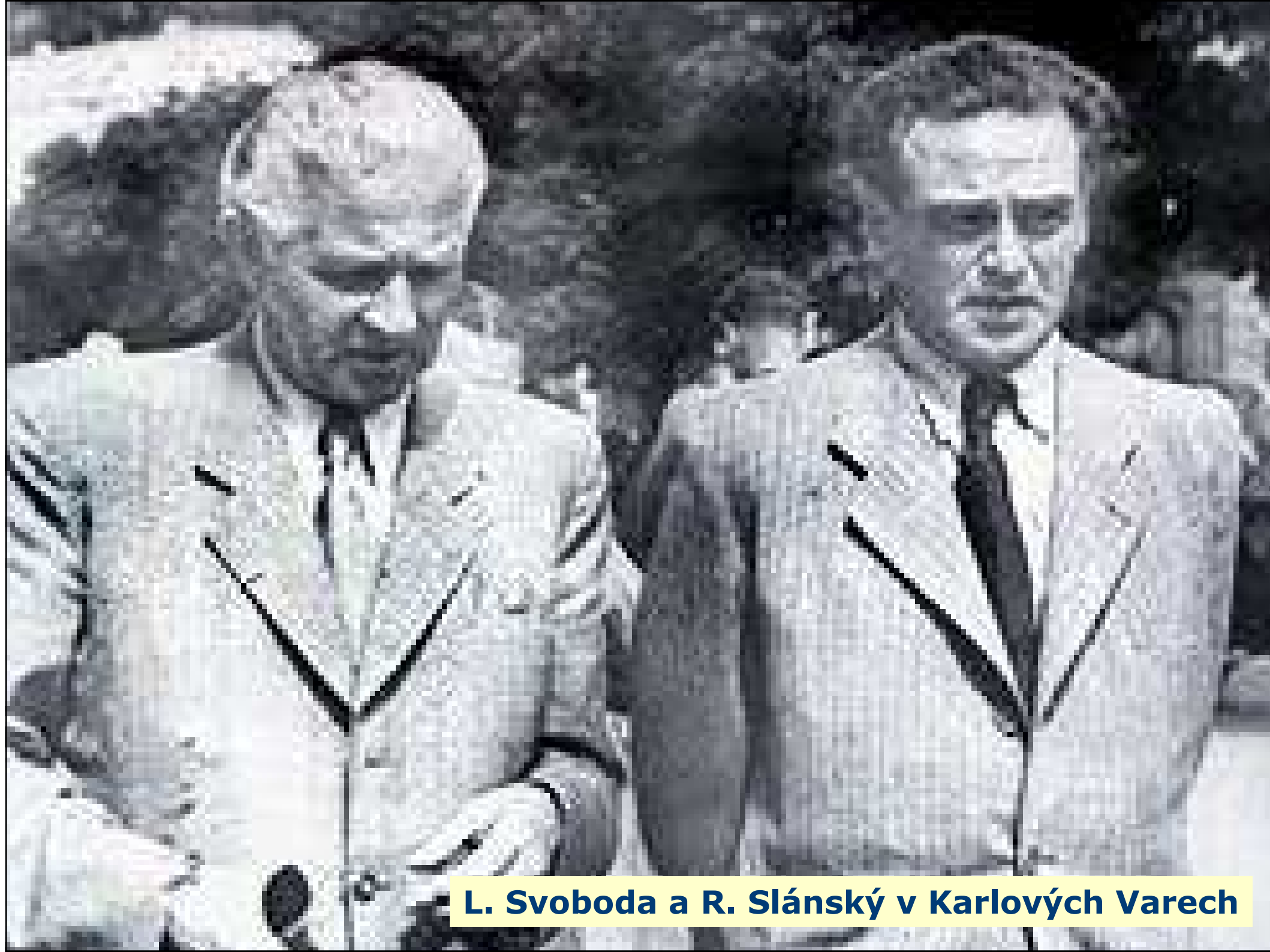
L. Svoboda a R. Slánský v Karlových Varech