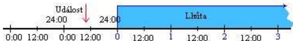
Obrázek 1 - Počátek běhu lhůt

Lhůta počíná běžet dnem (počátkem – 0:00 hod) následujícím od rozhodné události (§ 122/1 OZ, § 266 odst. 1 ZP, § 57 odst. 1 OSŘ, § 60 odst. 1 TRŘ, § 40 odst. 1 písm. a) SŘ, § 40 odst. 1 SŘS, § 14 odst. 6 ZSDP, § 128 odst. 1 ZSZ).