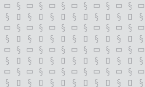
MAPKA z 8. 10. 2010