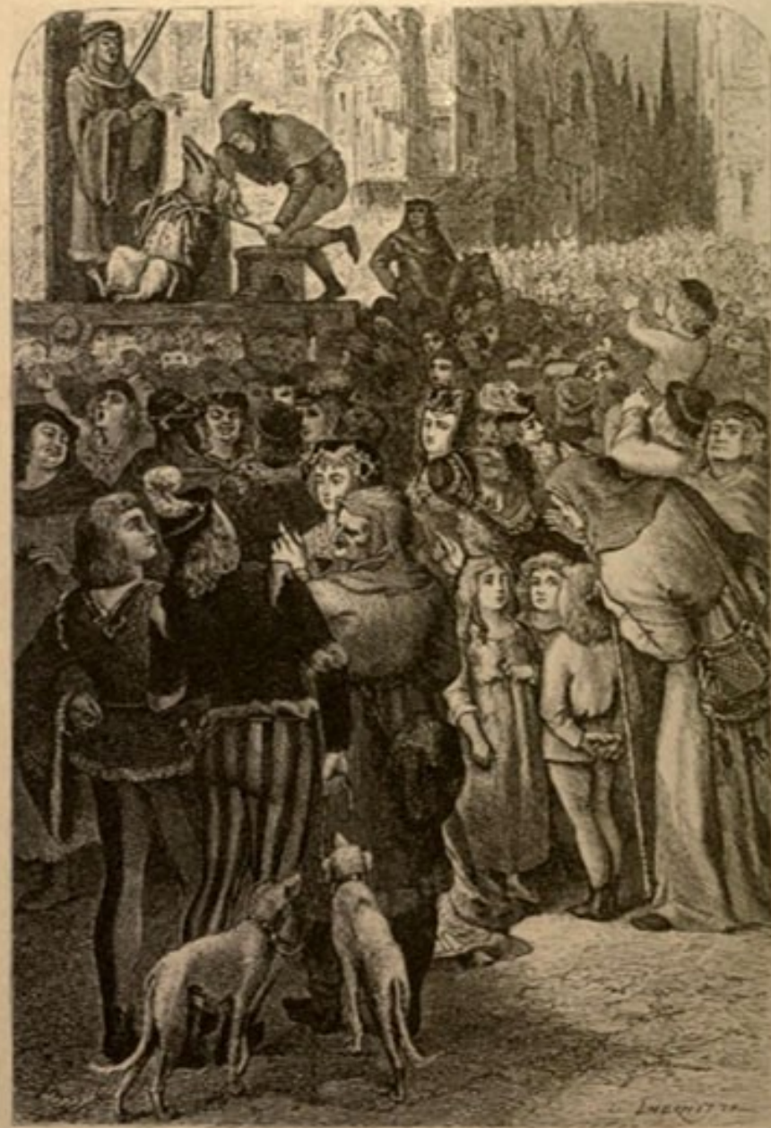
Execution of a Saw.