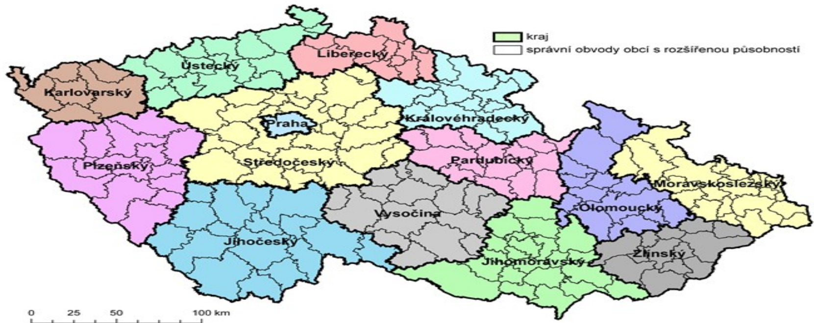
Územně správní členění České republiky