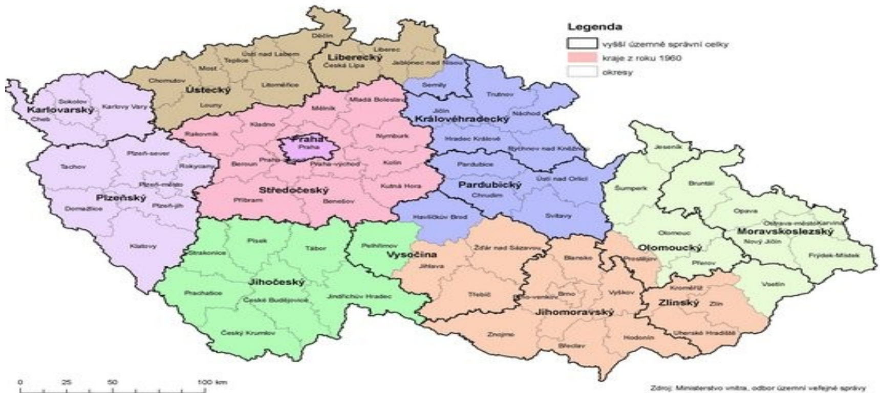
Znázornění dvojího krajského členění