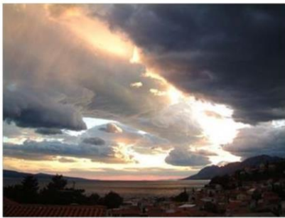
Čistý vzduch se stává velmi vzácným zbožím. ilustrační foto

Čistý vzduch se v nejbližších pěti letech stane zřejmě velmi cenným vývozním artiklem. Zájemci se už houfují u plynových kohoutů, které ovládá ministerstvo životního prostředí a které se poprvé v historii otevřou v příštím roce.