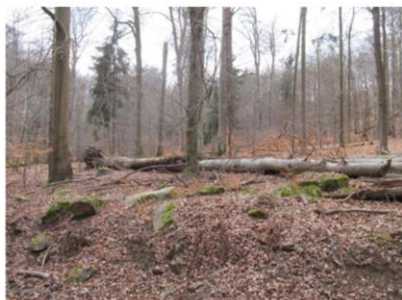
MP904Zk - Právo životního prostředí II

Video v článku. Sněmovna bude 21. 2. rozhodovat o konečné podobě novely zákona o ochraně přírody a krajiny. Novela chce změnit pravidla pro vyplacení náhrad újmy za to, že úřední omezení spojená s ochranou přírody ztěžují majitelům lesů hospodaření. Pokud bude schválena, prostředky nebudou vypláceny správcům státních lesů, zatímco jiným vlastníkům ano. Návrh novely ZOPK jednoznačně povede k prohloubení střetu vlastníků a správců lesních majetků se zájmy státní správy ochrany přírody. Potřebu ochrany přírody jako takové vlastníci lesa nezpochybňují, naopak, ochrana přírody je neodmyslitelnou součástí práce lesníků, jde však o míru požadavků jak orgánů státní správy, tak NGO.