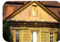
Záchrana kulturních památek