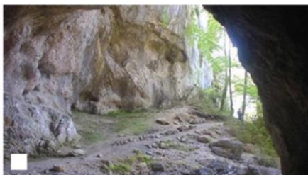
Poustevník z Brna, který na Slovensku žije v jeskyni, vadi tamějším ochráncům přírody. Ilustrační foto

Brněnský poustevník našel útočiště v jeskyni přímo uprostřed Národního parku Slovenský ráj. Podle deníku Nový čas se Marek Š. do Slovenského ráje zamiloval před pár lety, když se zúčastnil výpravy po zdejších jeskyních.