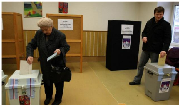
V Zábřehu se v rámci prezidentských voleb konalo i referendum o tom, zda má město prodat pozemky na stavbu papírny a elektrárny Wanemi.

Referendum, ve kterém lidé ze Zábřehu na Šumpersku hlasovali o projektu stavby papírny a elektrárny Wanemi, skončilo pro firmu neúspěchem. Většina voličů dala negativní odpověď na otázku, zda má město prodat potřebné pozemky. Celkem v referendu hlasovalo 6 867 lidí a 5 241 z nich papírnu odmítlo.