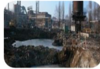
Asanace a ozdravení území