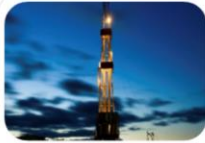
Vybrané geologické práce