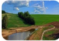
Územní systémy ekologické stability