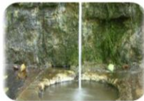
Ochrana přírodních léčivých zdrojů