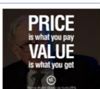
Prospěch z omezení