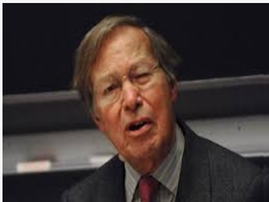
Ronald Dworkin (1931-2013)