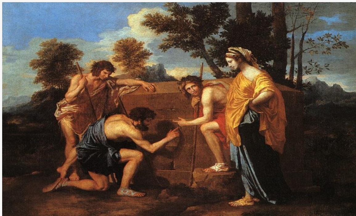
Nicolas Poussin, 1637/38, Louvre, Paris

„Lidé více statek a zboží než přátely milují.“ (Všehrad)