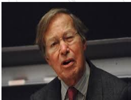
Ronald Dworkin (1931–2013)