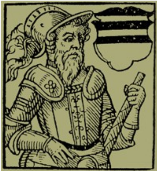
Hynek z Poděbrad (1452-1492)

„ein schöne iunckfraw ... pey czwelff iaren alte“ mění na