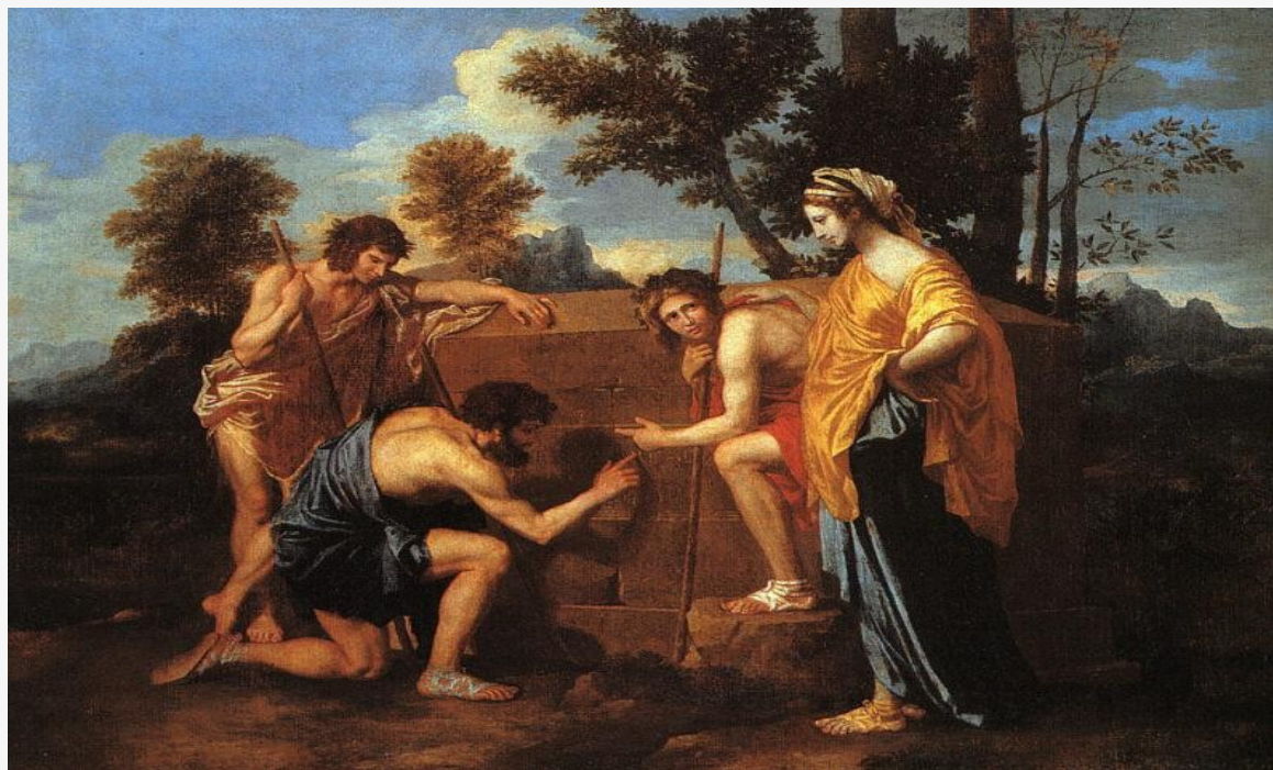
Nicolas Poussin, 1637/38, Louvre, Paris

„Lidé více statek a zboží než přátely milují.“ (Všehrad)