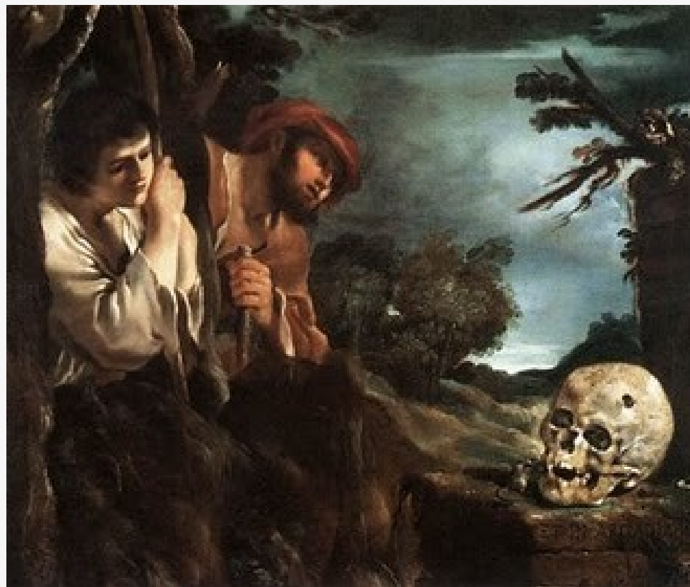
Guercino, 1618-22, Galleria Nazionale d'Arte Antica, Roma