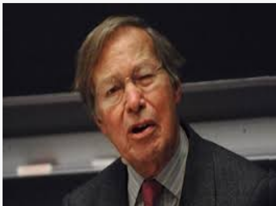
Ronald Dworkin (1931-2013)