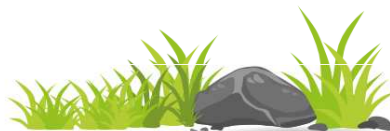
Ulož.to – Greenmania

Na vypěstování každé rostliny je zapotřebí alespoň půl litru vody a k vodě můžete přijít mnoha různými způsoby. Někdy prostě jenom tak naprší. Jindy se vám bude líbit nějaký soubor, pak si třeba poklábosíte s jiným uživatelem nebo svým kamarádům pošlete fotky z posledního společného výletu.