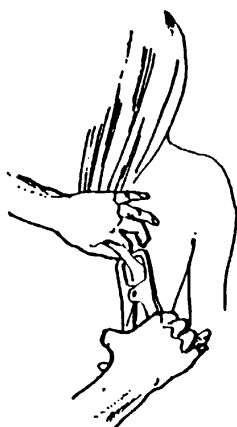
Kožní řasa nad lopatkou

Přehled standardních měřících míst je uveden na obr. níže. V praktiku pro další možný způsob hodnocení zastoupení tuku v organismu z nich použijeme ještě měření kožní řasy nad lopatkou