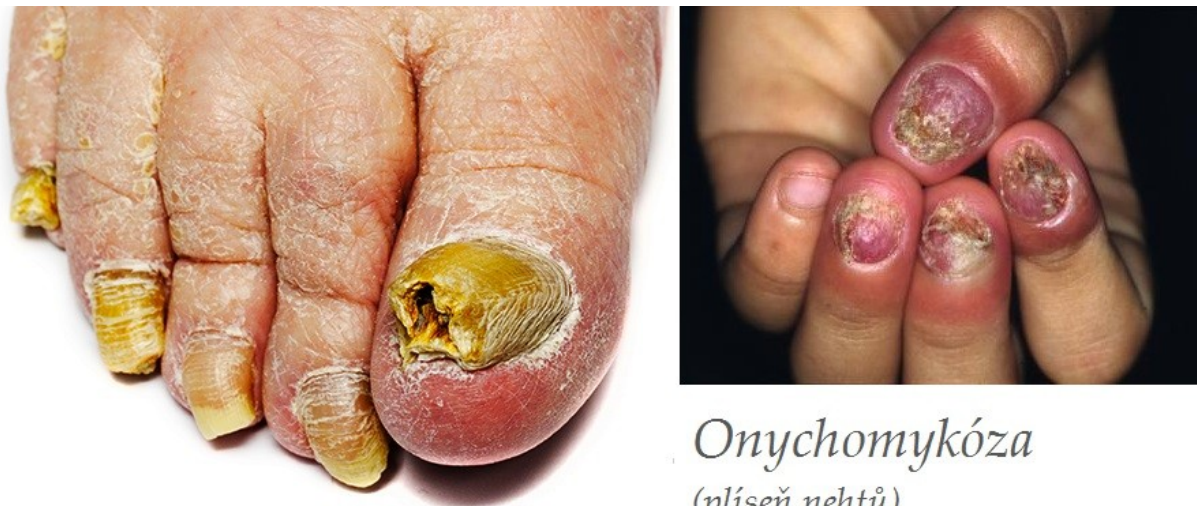
Onychomykóza (plíseň nehtů)

Onychomykóza (anglicky onychomycosis) je mykotické (plísňové) onemocnění nehtů, převážně na nohou. Často navazuje na plísňové onemocnění nohou (tinea pedis). Původci této nemoci jsou dermatofyta, kvasinky (Candida)