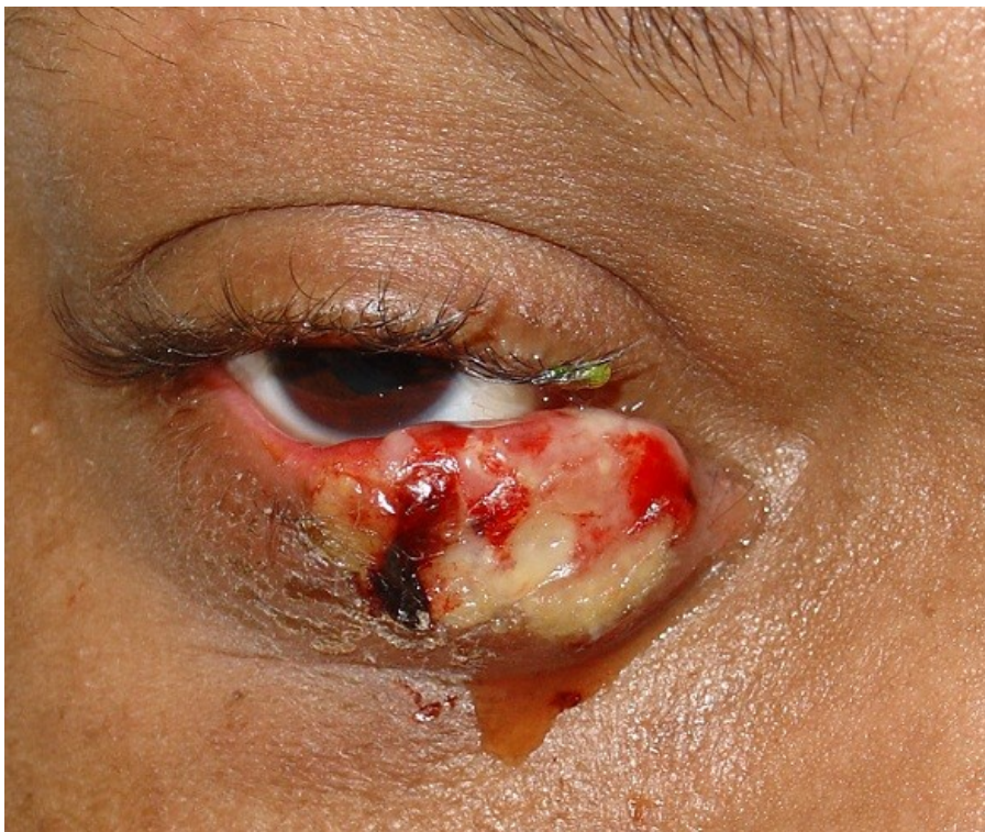
opar očního víčka