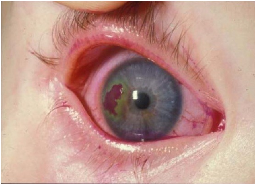
opar rohovky – zobrazení po obarvení oftalmologickým barvivem

dávky Riboflavinu. Výskyt na genitálu v období porodu je důvodem k zvážení strategie vedení porodu.