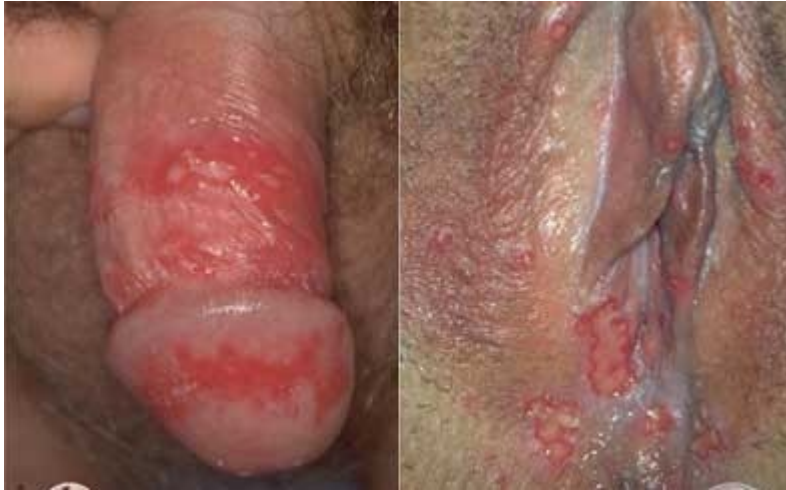
herpes simplex genitalis - penis, vagina