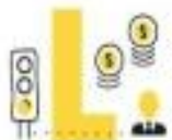
Leadership on road safety