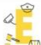
Enforcement of traffic laws