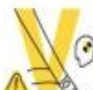
Vehicle safety standards