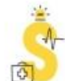
Survival after a crash