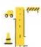
Infrastructure design and improvement