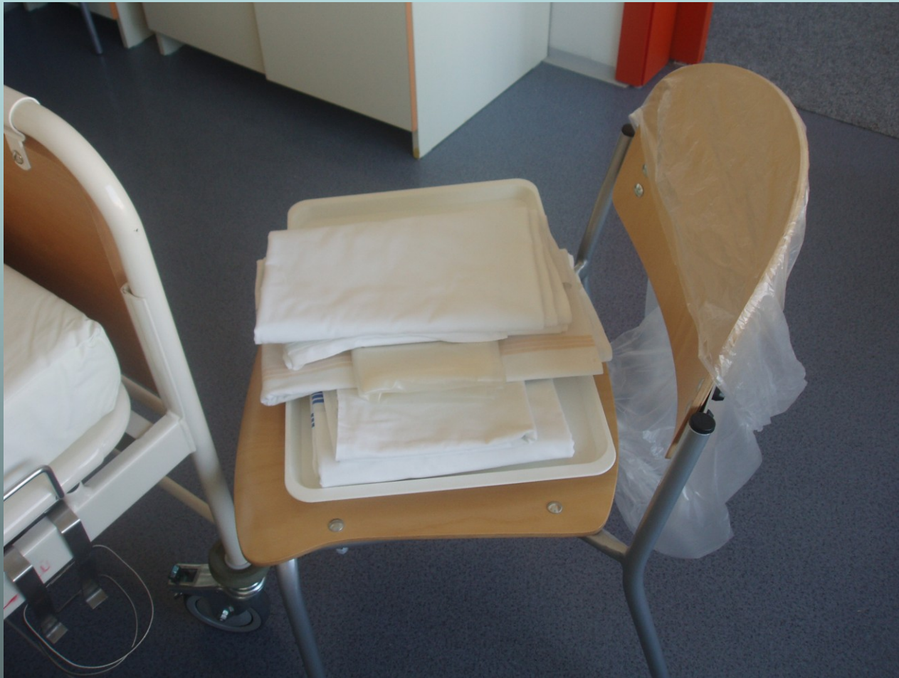
ložní prádlo připravené na židli vak z PVC na špinavé ložní prádlo