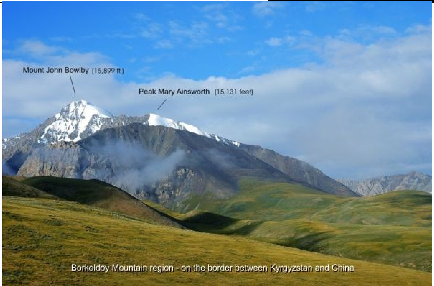
Borkoldoy Mountain region - on the border between Kyrgyzstan and China