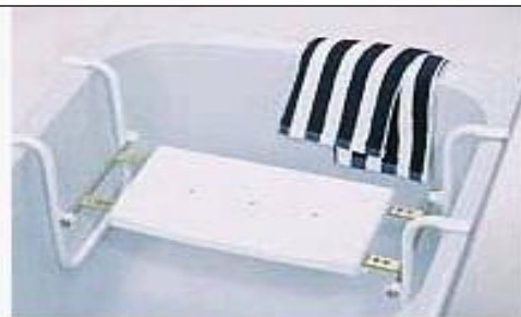
Závěsná sedačka do vany