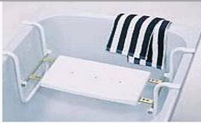
Závěsná sedačka do vany