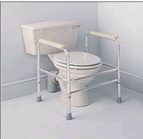
Přenosná podpěra na WC