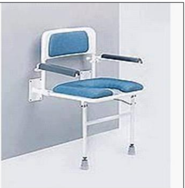
Sedačka do sprchy sklopná