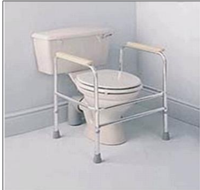
Přenosná podpěra na WC