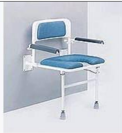
Sedačka do sprchy sklopná