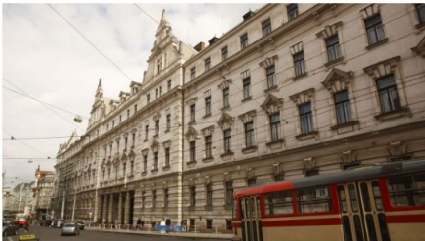
Ilustrační foto: Městský soud v Praze

Vašeho kolegu napadl pacient s psychickou poruchou