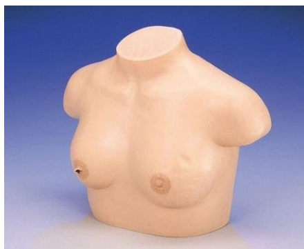
Obr. 3: Simulátor vyšetření ženských prsů