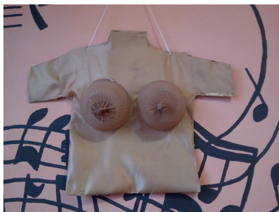
Obr. 4: Model ženských prsou vyrobený studentem