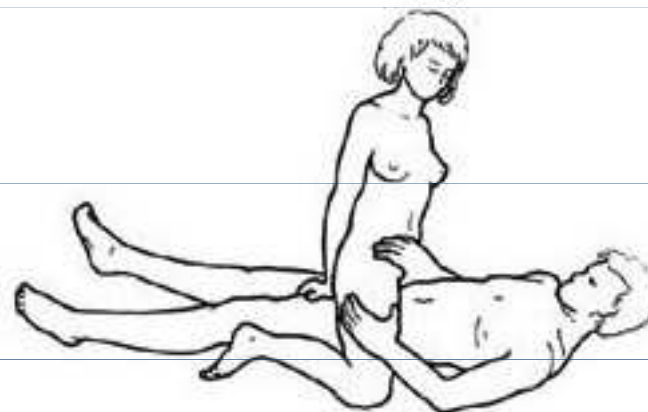
Obr. 9 Dráždění poštvěváčku rukou při zasunutém údu