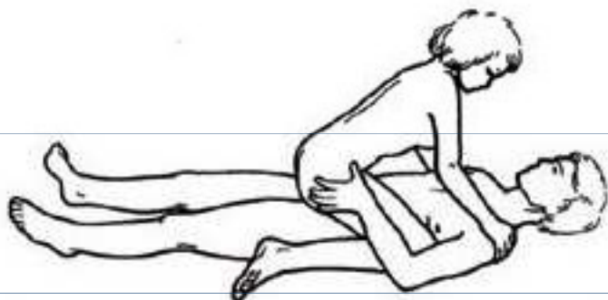
Obr. 8 Žena si zasunula úd do pochvy