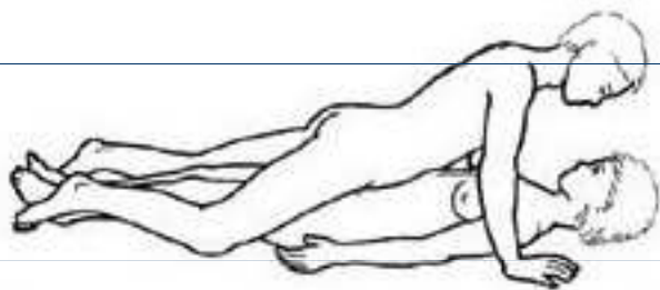
Obr. 12 Poloha ženy dole s nataženým tělem