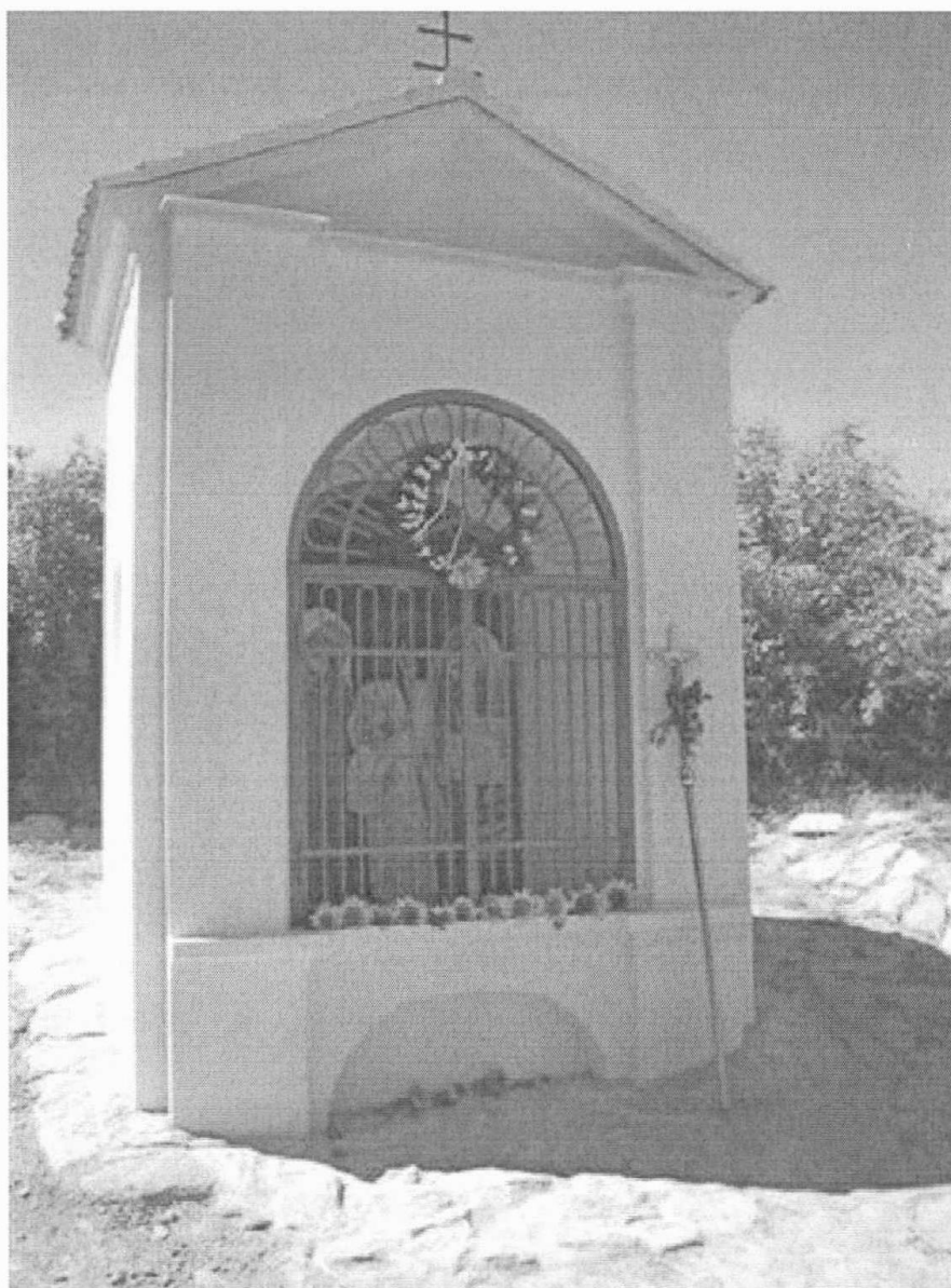
Poklona za farou v Popicích

Když jste vyšli z lesa, zjevilo se před Vámi toto panorama. Je to místo, kde jste poprvé zahlédli cíl vaší „pouti“ z Jedovnic – farní kostel Jména Panny Marie ve Křtinách. Katoličtí poutníci v takovýchto místech staví tzv. poklony – speciální stavby s vyobrazením Zjevení Panny Marie nebo Božího zjevení. Dodnes si můžete takovýchto poklon všimnout na kopcích před vesnicemi. Pokuste se takovou poklonu vyrobit z toho, co najdete kolem tohoto místa jako dík za to, že jste zdárně urazili takovou „dlouhou cestu“.