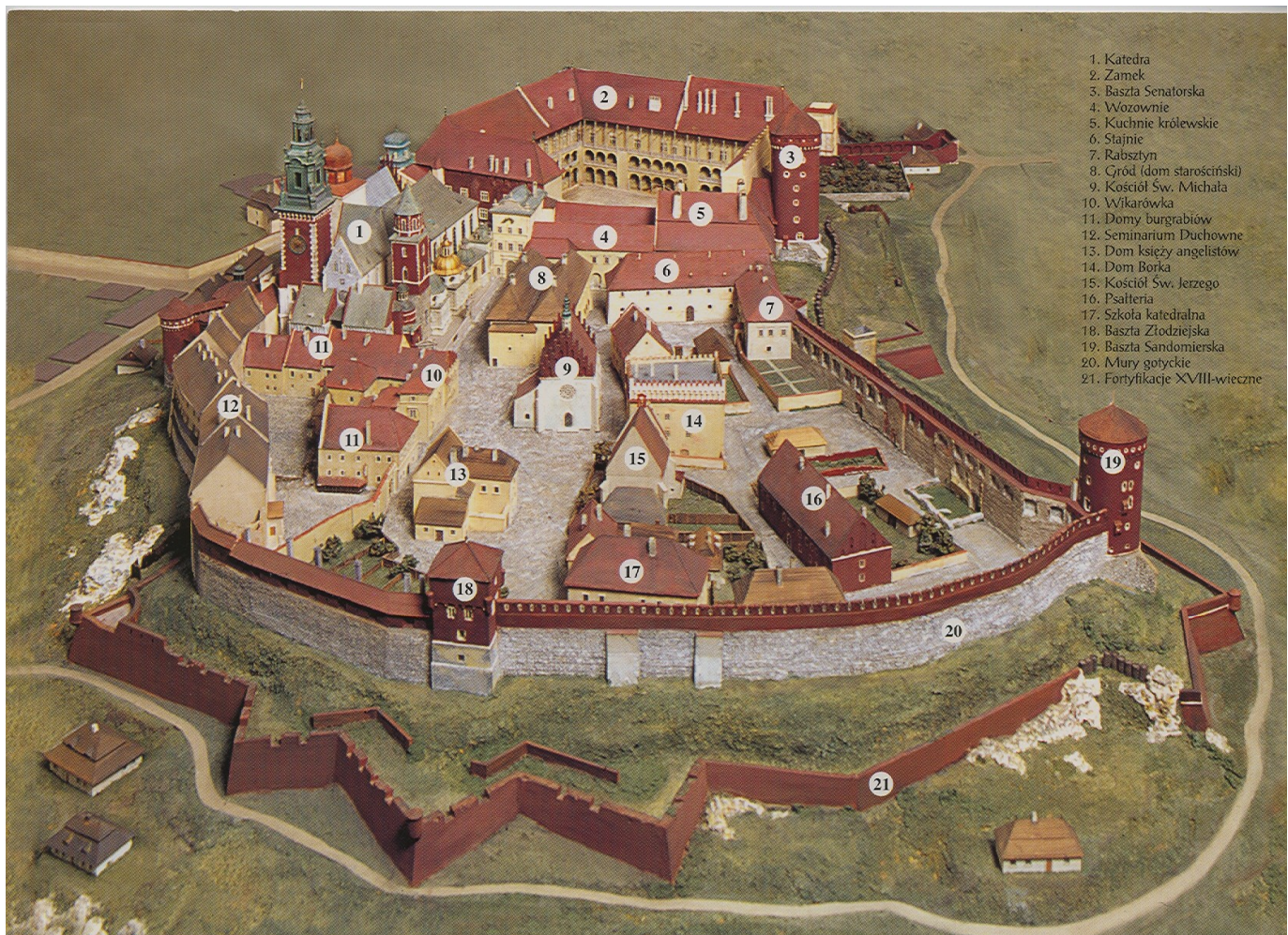
Obr. 1 KRAKOW – WAWEL – renesanční zámek + katedrála sv. Stanislava s hroby polských králů

K nejpříkladnějším dílům renesanční urbanistiky náleží Zamość . (dnes UNESCO)