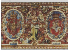
▲ Arras z herbami Korony i Litwy ze zbiorów na Wawelu symbolizuje jedność państwa polsko-litewskiego, zwanego od czasów unii lubelskiej Rzeczpospolitą Obojga Narodów.