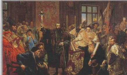
◀ Unia lubelska z 1569 roku zmieniła unie polsko-litewską z personalnej (gdzie oba państwa łączyła jedynie