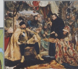
▶ Król Stefan Batory pod Pskowem. Jego kampania w Inflantach (1579–82) przeciw wojskom cara Iwana IV Groźnego zakończyła się pełnym sukcesem. (Obraz Jana Matejki).