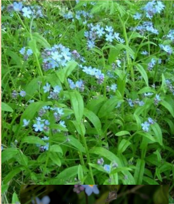
Pomněnka lesní ( Myosotis sylvatica )