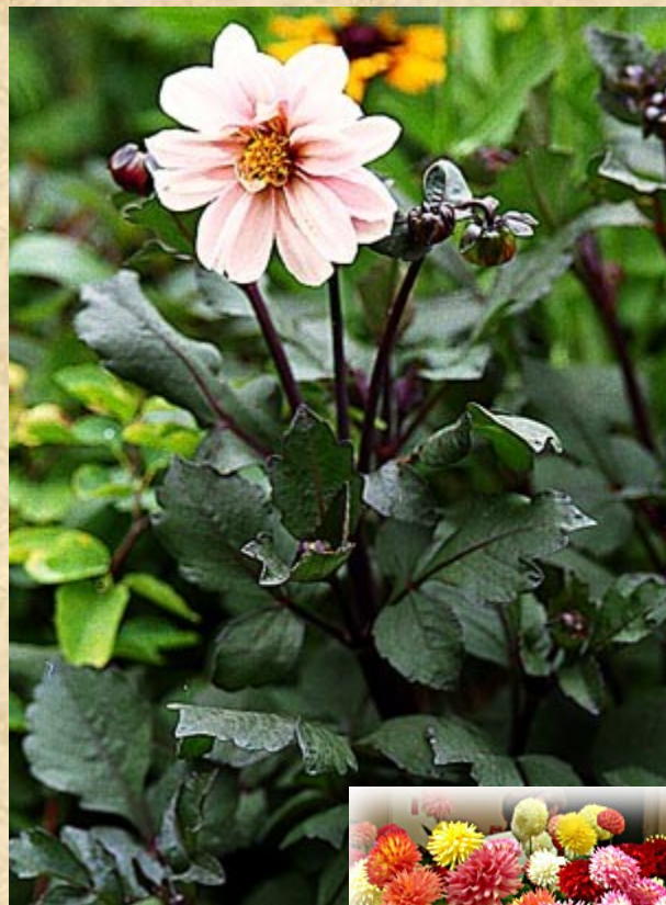
Jiřina ( Dahlia )