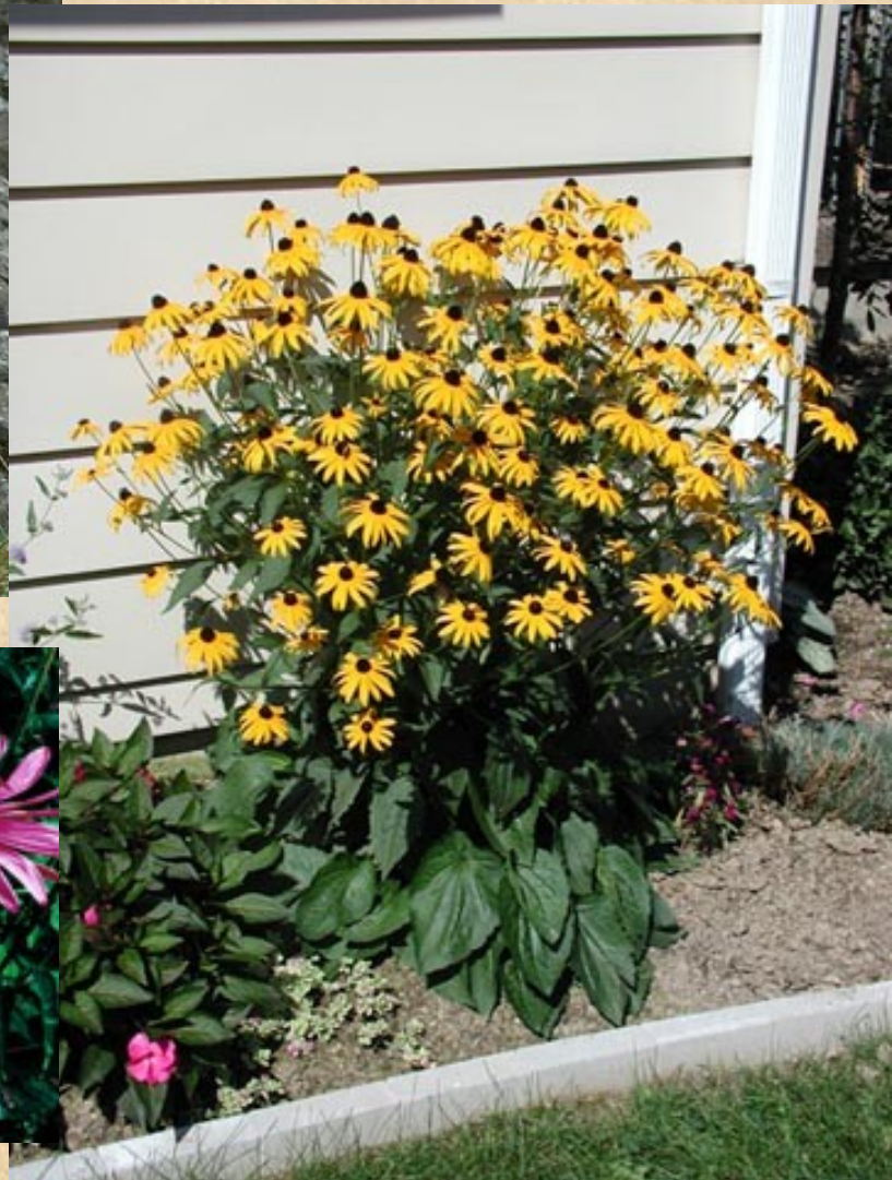
Rudbekie ( Rudbeckia )