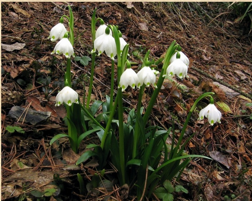
Bledule jarní ( Leucojum vernum )