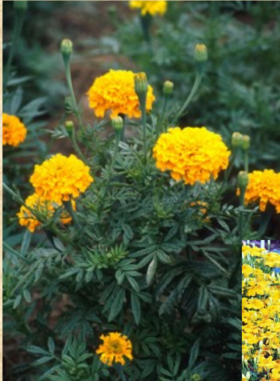
Aksamitník ( Tagetes )