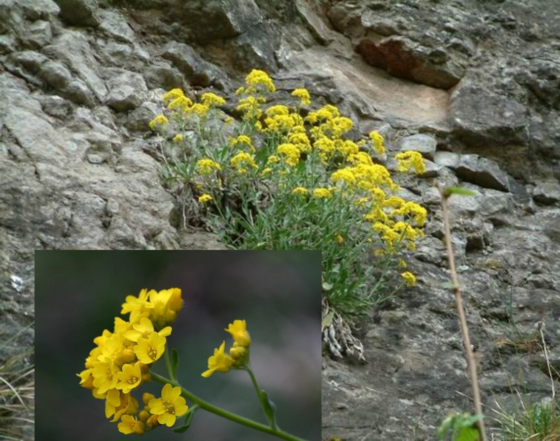
Tařice skalní ( Aurinia saxatilis )