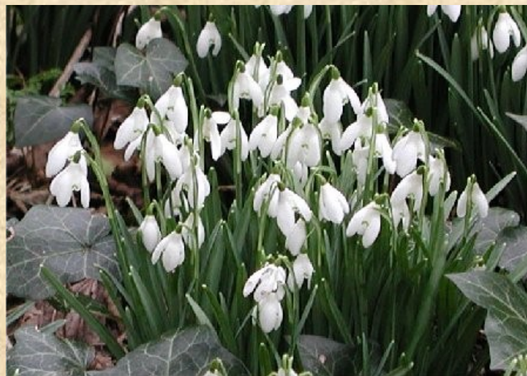
Sněžěnka podsněžník ( Galanthus nivalis )