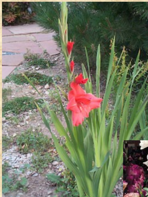
Mečík ( Gladiolus )