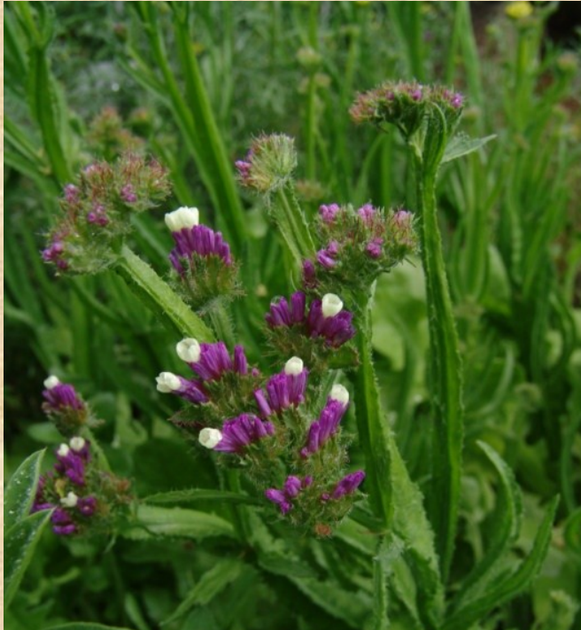
Statice ( Limonium )