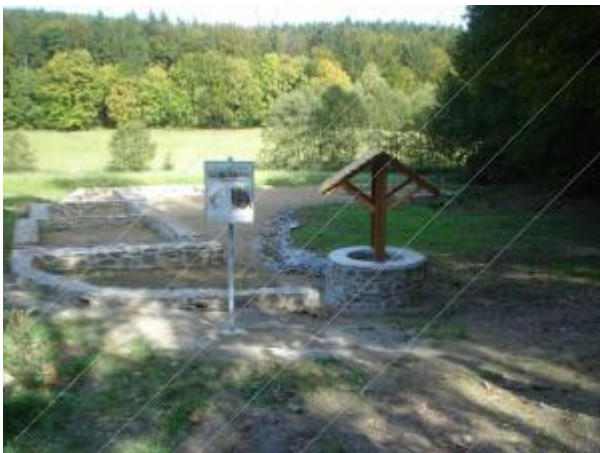
Na obrázku je ukázka odkrytých základů domů zaniklé osady Bystřec

2. Napište si stručnou historii o zaniklé obci Bystřec: