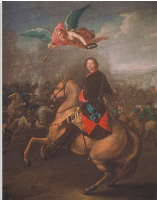
▲ Peter der Große (1672–1725) krönte sich 1724 als „Czaar und Imperator von aller Land“ zum ersten „Kaiser“ Russlands. Das Gemälde von Gottfried Danhauer zeigt ihn in der Schlacht bei Poltawa 1709, in der er die Schweden unter Karl XII. entscheidend besiegen konnte.