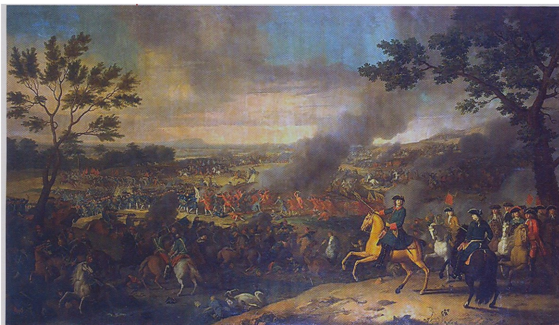
Bitva u Poltavy 1709 – vpravo od středu Petr Veliký (na koni – doslova i obrazně)

Rozhodující střet mezi Petrem I. a Karlem XII. se odehrál u města Poltavy , na severovýchodní Ukrajině 8. července 1709 . (proti sobě přes 40 tis. Rusů, proti nim 22 tis. Švédů plus kozácké posily). Švédská vojska podporovaná Mazepovými oddíly zde byla poražena, možná tomu napomohlo i zranění Karla XII v první části bitvy. Podařilo se mu však uniknout, stejně jako Mazepovi. Na JZ, na dnešním Moldavském území se dostali pod tureckou patronaci. Mazepa zde v září 1709 zemřel. Dostal se později v literárních dílech do role národního hrdiny usilujícího o samostatnost Ukrajiny.