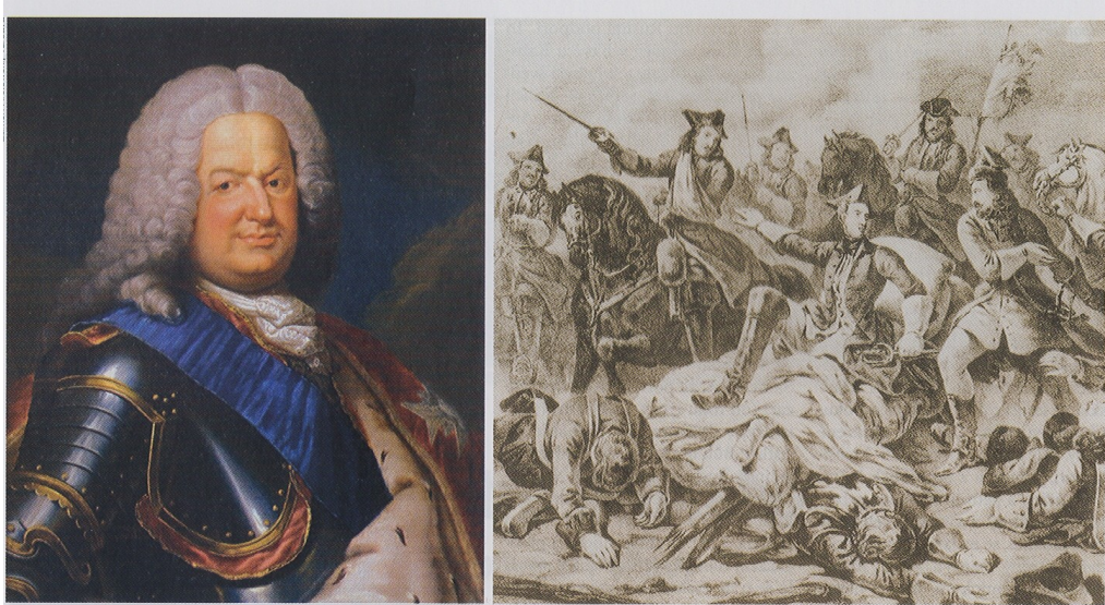
Stanislaw Leszczyński (vlevo); zraněný Karel XII. v bitvě u Poltavy (vpravo)

Petrovi se v mezičase podařilo dokončit modernizaci armády , která mohla být příslibem v nových střetech se Švédy. Zatímco se Švédové vyčerpávali v Polsku, Petr se zmocňoval části východního Pobaltí a dokonce zde zahájil výstavbu Petrohradu , budoucí metropole. (1703 stavba Petropavlovské pevnosti). Hlavním městem se stal PETROHRAD – Sankt Pěťěrburg roku 1712. Výstavba probíhala díky zahraničním architektům a k osídlení tohoto města nařídil Petr nucené přesídlování.