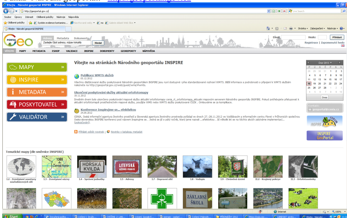
Obr. 1: Náhled na úvodní stránku národního geoportálu, pokračujte kliknutím na kterýkoliv obrázek dole

Odkaz Národní geoportál: http://geoportal.gov.cz