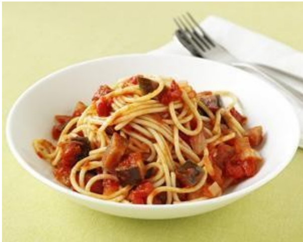
Des spaghetti aux aubergines