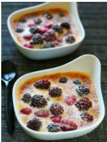
Petit gratiné de fruits rouges