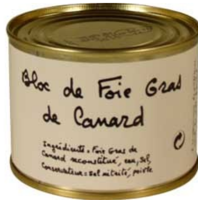
Boîte de foie gras