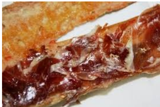
Sandwich au Jabugo