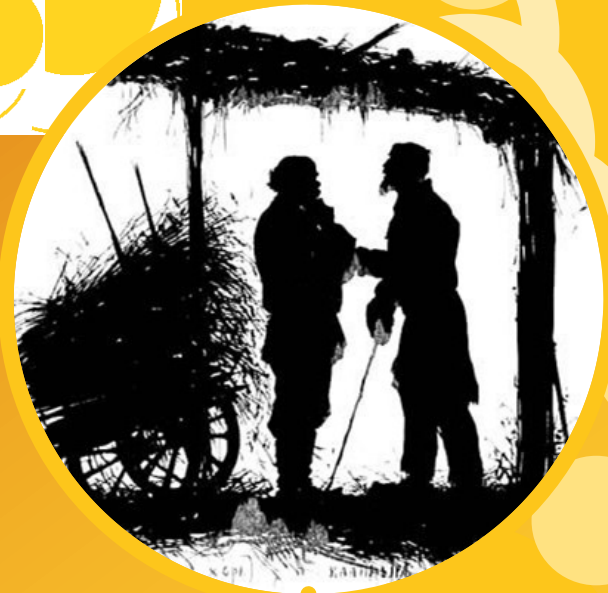
«Хорь и Калиныч»

Свои рассказы Тургенев создавал за границей, так как он считал, что русское общество на него плохо влияло.