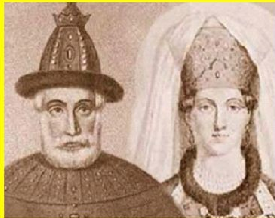
Василий III и Елена Глинская