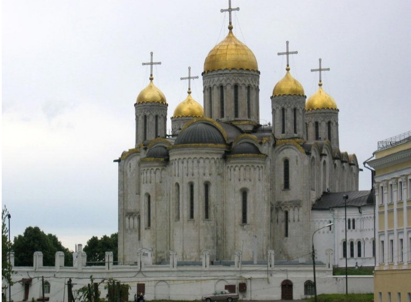
Chrám Nanebevzetí Bohorodičky