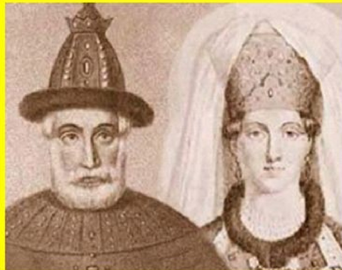
Василий III и Елена Глинская