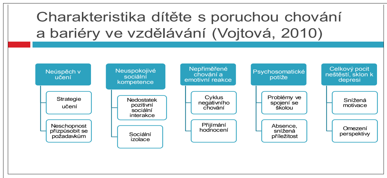
Obr. 2: Bariéry ve vzdělávání dětí s poruchou chování (Vojtová, V., 2010)