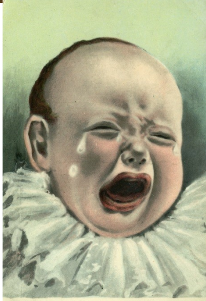
Mummy's a Suffragette.