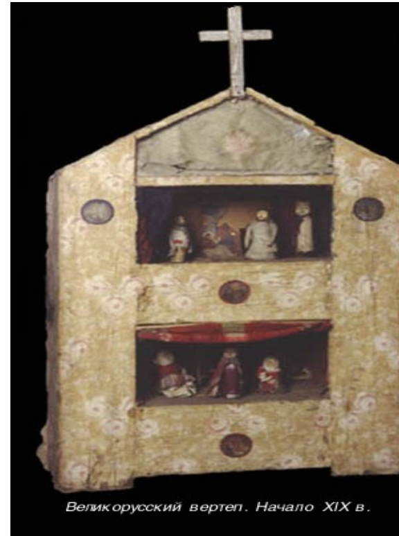
Великорусский вертеп. Начало XIX в.