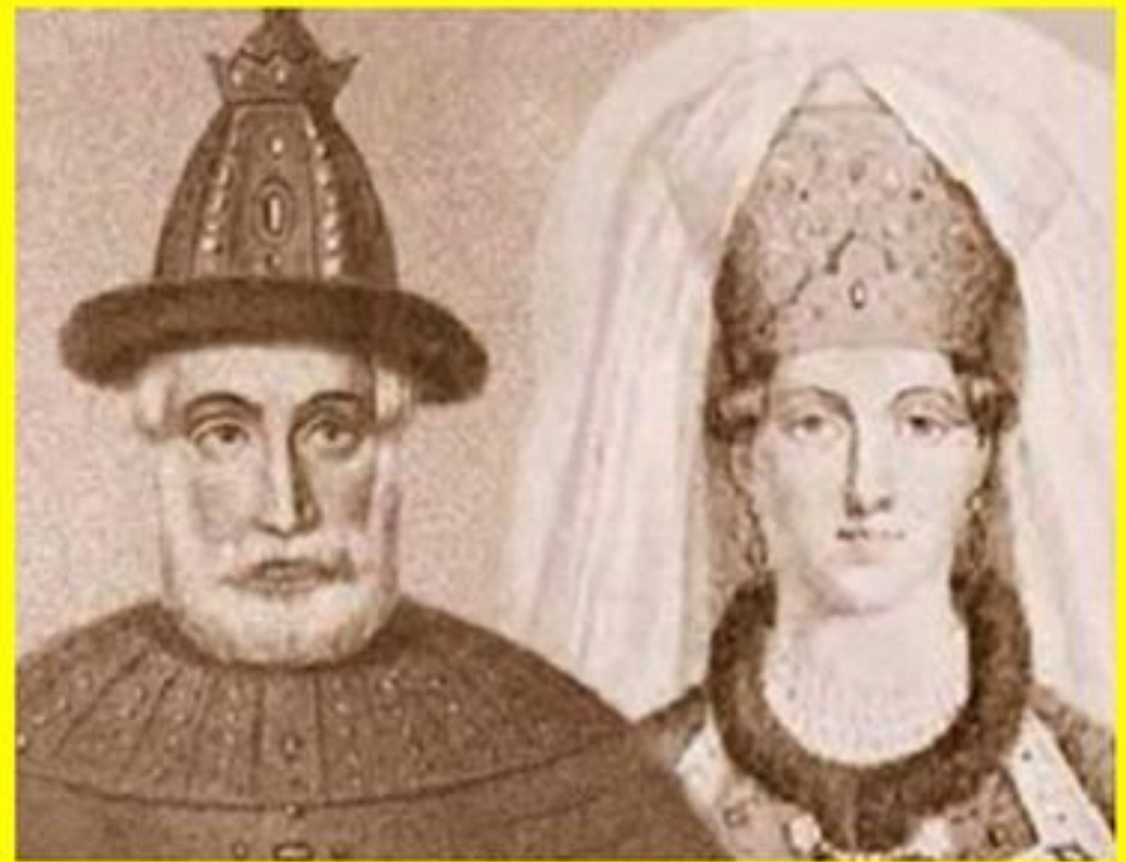
Василий III и Елена Глинская