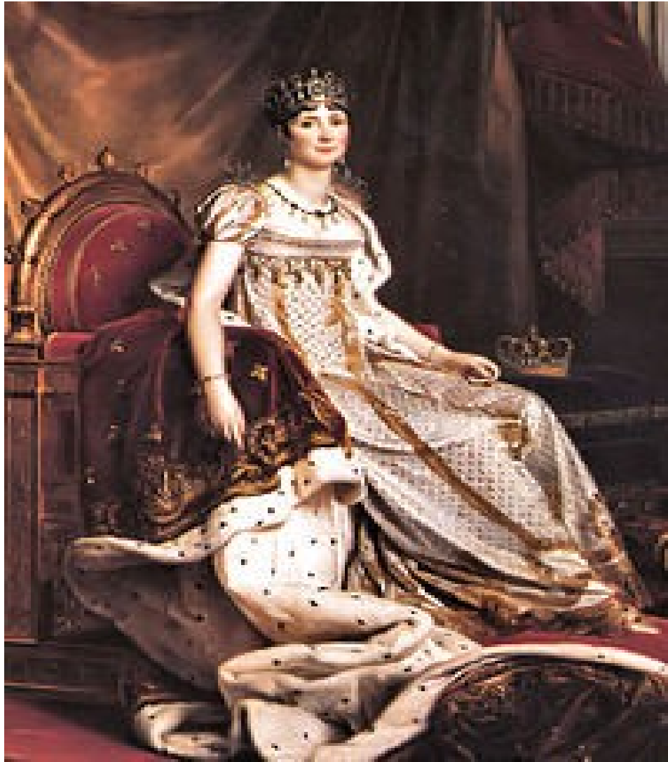
Marie Luisa Habsbursko-Lotrinská