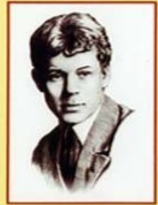
ЕСЕНИН Сергей Александрович (1895-1925)