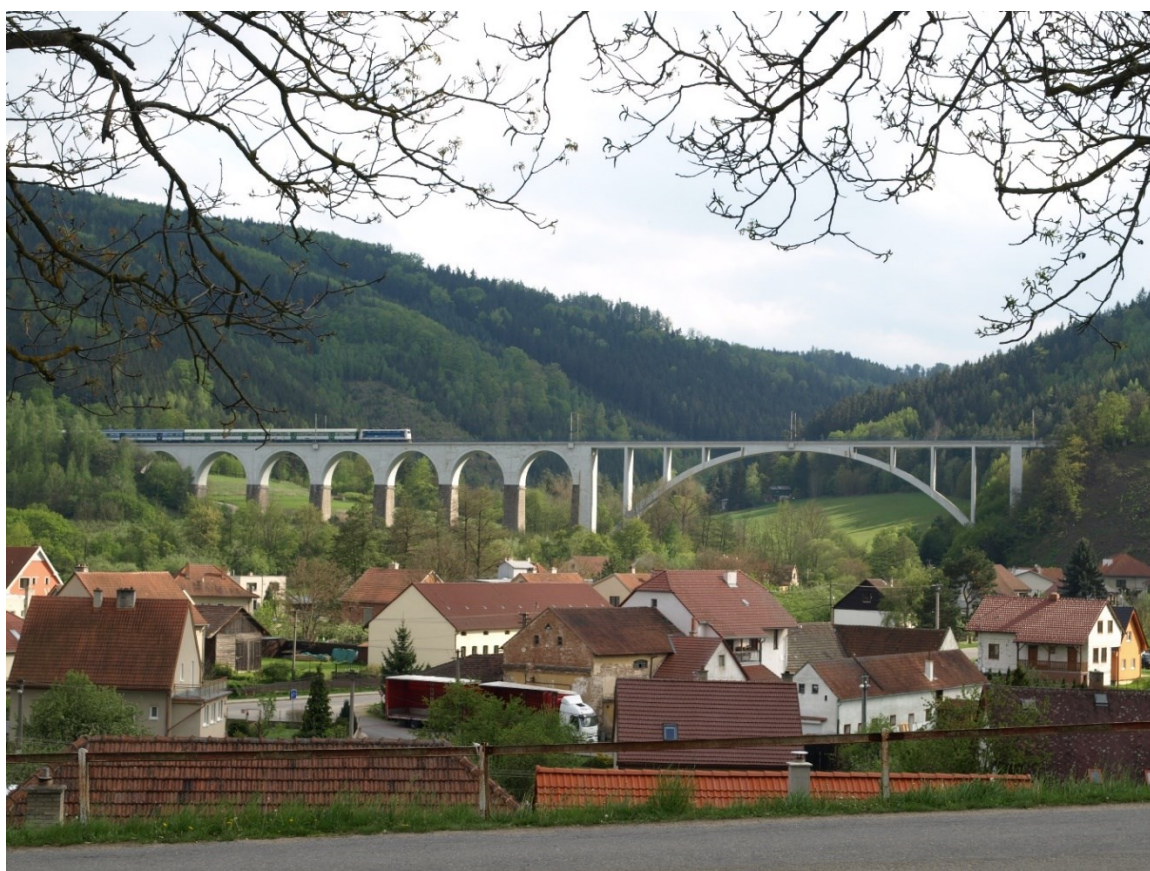
Nádherný železniční viadukt u Dolních Louček na Tišnovsku

Poutní a farní kostely a kaple jsou typickými dominantami české i moravské krajiny. Okolní barokní krajina však o mnohé součásti (kapličky, křížové cesty, atd.) v průběhu dalších století přišla. Na snímku klášter Dolní Hedeč nad městem Králíky.