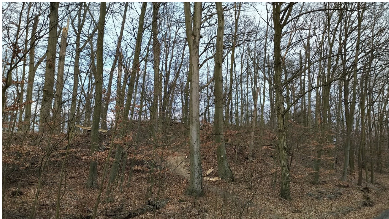
Nepatrné zbytky hradu RONOV severně u Brna (mezi Útěchovem a Adamovem) odhalíme podle nápadných změn reliéfu připomínající někdejší jádro hrádku, hradby a příkopy.