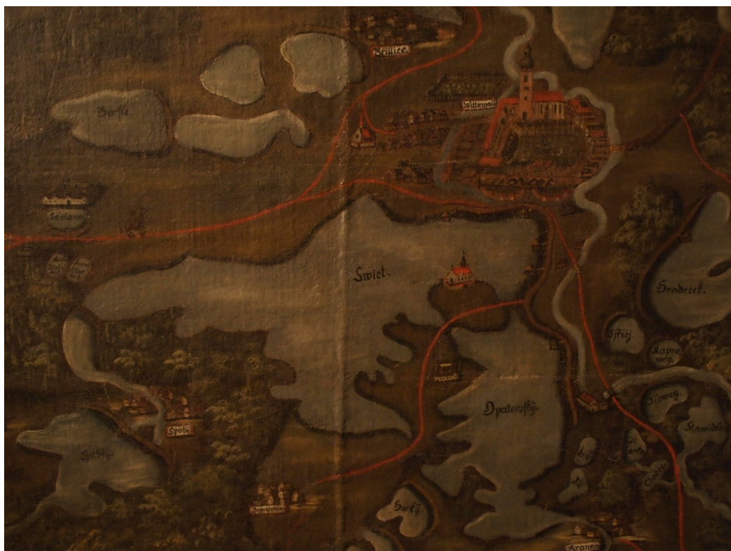
Rybník svět (3. největší rybník) a město Třeboň (s kostelem sv. Jiljí, ale ještě bez zámku bez Schwarzenberské hrobky na protilehlé straně.