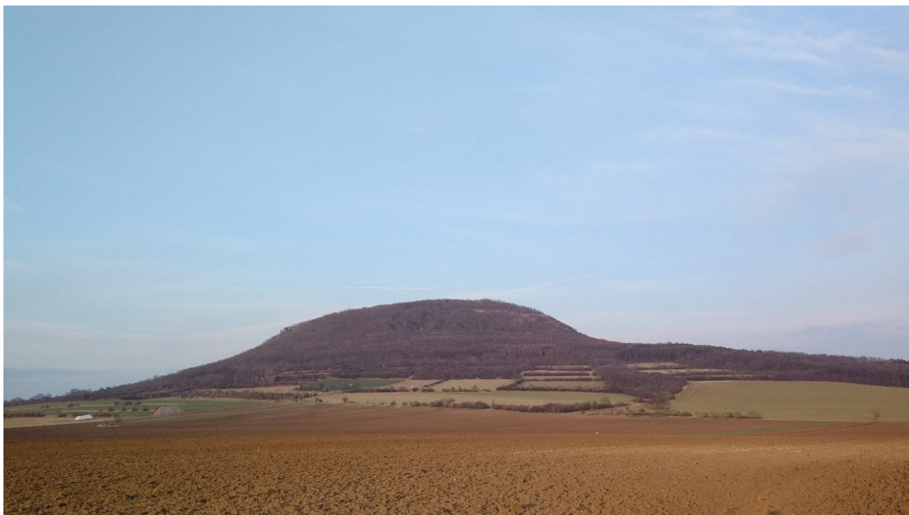
Památná hora Říp i přes malou výšku vévodí rovinaté krajině severně od Prahy, u Roudnice nad Labem.