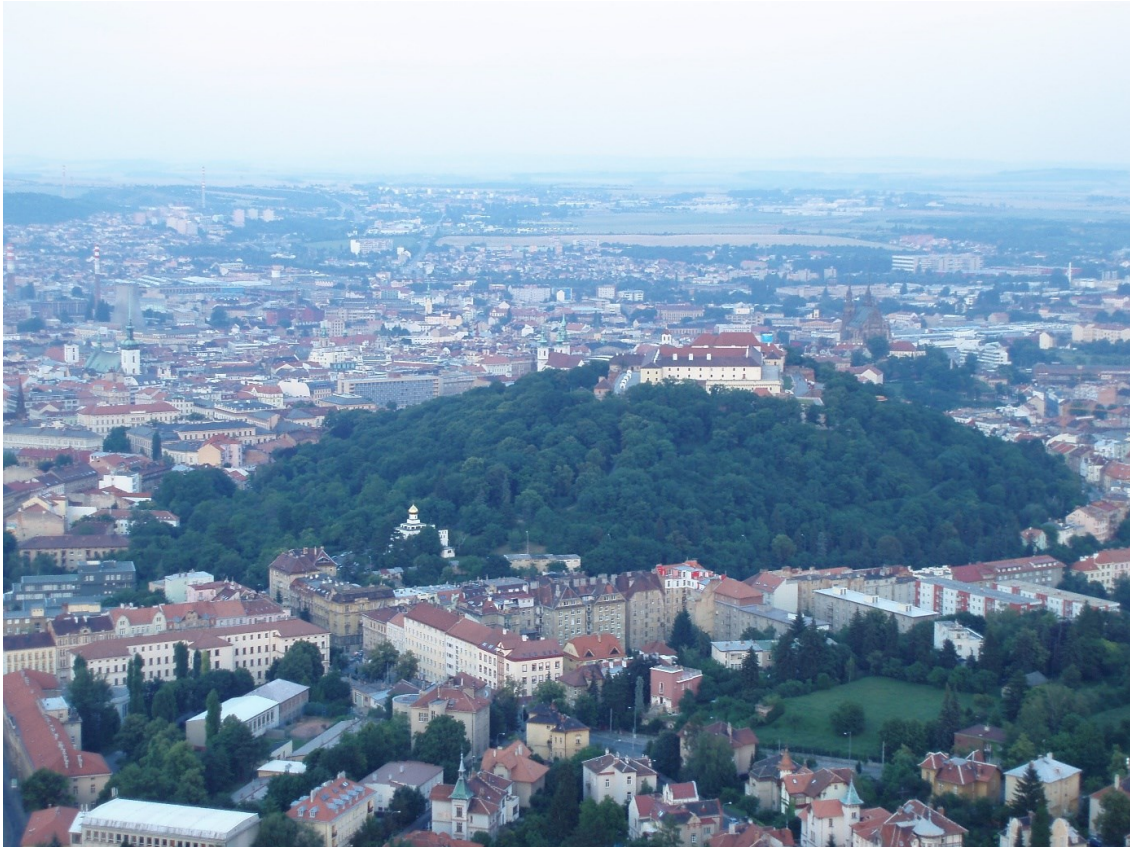
Zalesněný Špilberk je dílem romantismu a budování parků v 19. století.