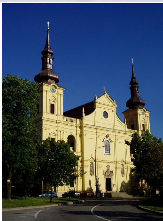
K nepoznání se změnilo poutní místo Tuřany. Nahoře v 17.století, za Balbína (z jeho Diva Tursanensis), dole přestavěný kostel (není vidět letiště vlevo za kostelem, zmizely pole, kapličky aj.