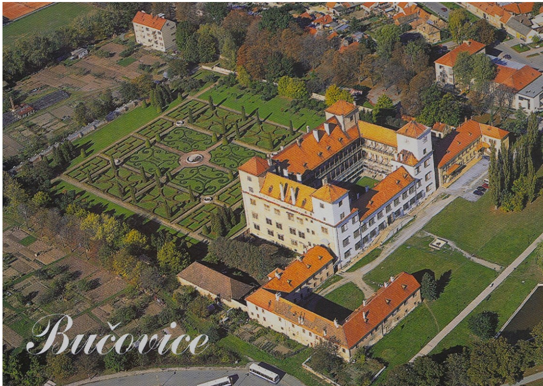
Renesanční zámek Bučovice, s manýristickými interiéry, má jednu z nejstarších dochovaných zahrad, tzv. italského stylu