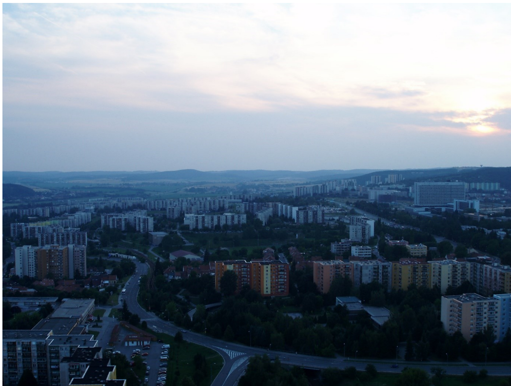
Sídliště (na snímku Bohunice, částečně Starý a Nový Lískovec), „nezbytný prstenec“ kolo našich měst ve 2. polovině 20. století.