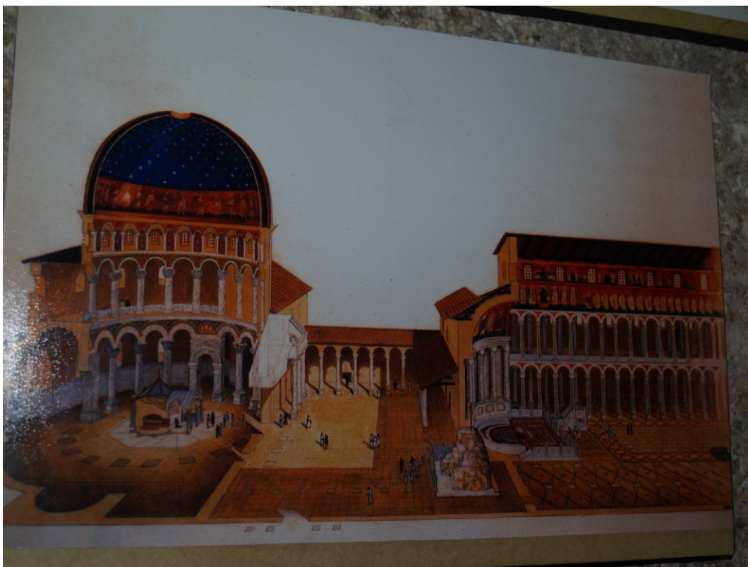
Chrám Božího hrobu v Jeruzaléme. V levé části je vidět Kristův hrob, uprostřed vpravo skála – Golgota – místo ukřižování.