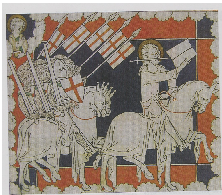
Křižáci vedení Kristem

Radulf z CAEN vypráví: „Přijavše kříž, vzdali se sebe samých a vystavili svá těla útrapám pro lásku k Bohu.“