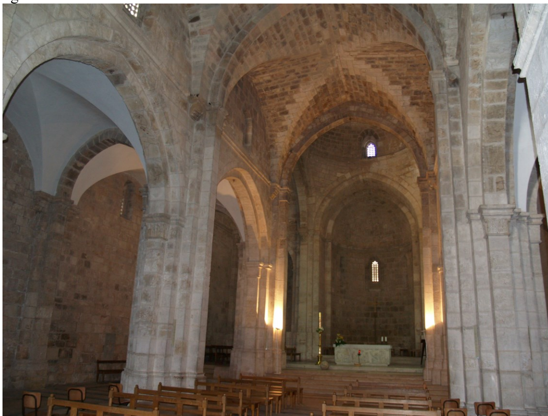
Kostel sv. Anny v Jeruzalémě je nejen památkou po křižácích, ale také nádhernou ukázkou toho, jak kostely původně vypadaly. Nádherná architektura, téměř a jen velmi prosté, téměř žádné vnitřní vybavení (lavice jsou nové).