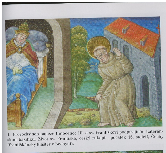
1. Prorocký sen papeže Innocence III. o sv. Františkovi podprajícím Lateránskou baziliku. Život sv. Františka, český rukopis, počátek 16. století, Čechy (františkánský klášter v Bechyni).