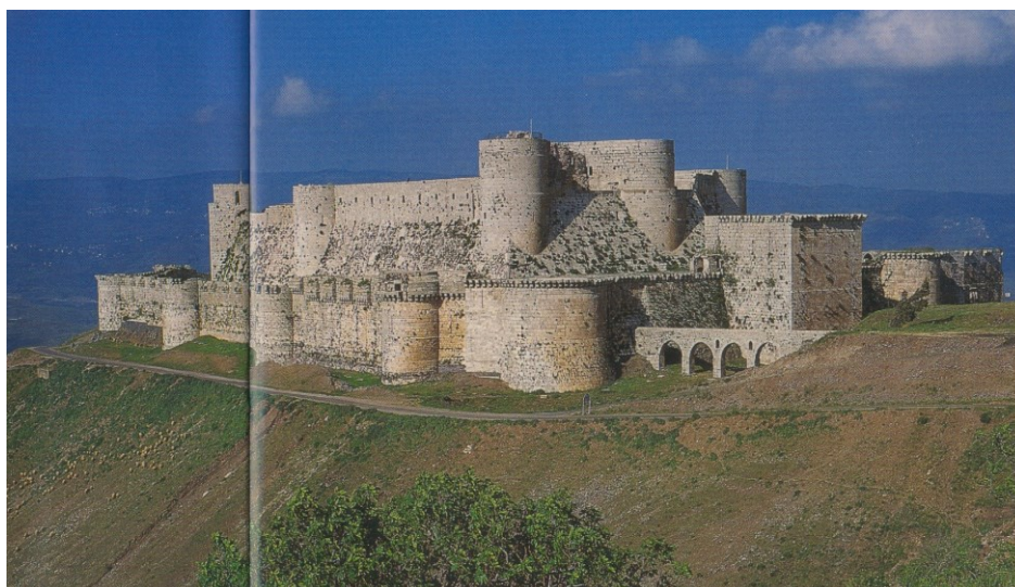
Největší z křížáckých hradů – Krak des Chivaliers (dnes v Sýrii)

EPILOG - VIII. VÝPRAVA 1270 - 72. Nepočetnou výpravu, spíš zoufalý pokus o ní vedl znovu LUDVÍK IX. za asistence anglického princ a následník trůnu EDUARDA (jeho vojsko - 1000 mužů, se přidalo až později). Výpravu provázela téměř naprostý nezáměr - malá šance na zvrát, přitom skutečnost byla ještě horší. Vojsko se podařilo dát dohromady jen s příslibem velké odměny. Po přistání v Tunisku Ludvík umírá, pravděpodobně na mor. Neklamným znamením toho, že se jedná o doznívání tažení, bylo také dobytí největšího hradu KRAK DES CHAVALIERS (hrad rytířů) roku 1271.