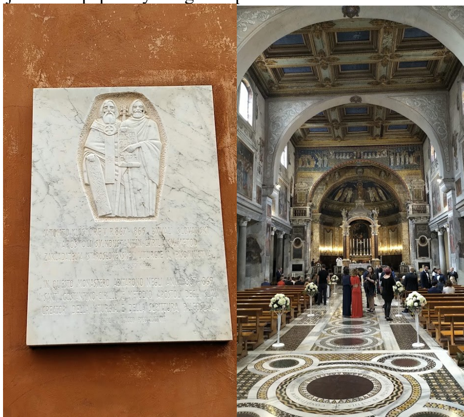
Kostel St.Prassede v Římě, u nějž v klášteře pobývali Cyril a Metoděj

Metoděj po svém návratu na Moravu pokračoval v apoštolské činnosti. Roku 869 papež Hadrián bulou Gloria in exelsis deo znovu potvrdil slovanskou liturgii a Metoděje jmenoval papežským legátem pro slovanské země.