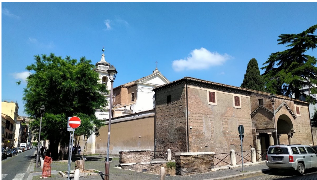
Bazilika sv. Klimenta poblíž Kolosea – místo, kde spočívají ostatky sv. Cyrila

povolenou. Při tomto pobytu v Římě zemřel Konstantin jako 42-letý, když předtím přijal řádové jméno Cyril. Jeho ostatky byly uloženy do krypty v bazilice sv. Klimenta – dodnes toto místo patří k tzv. českým zastavením v Římě.