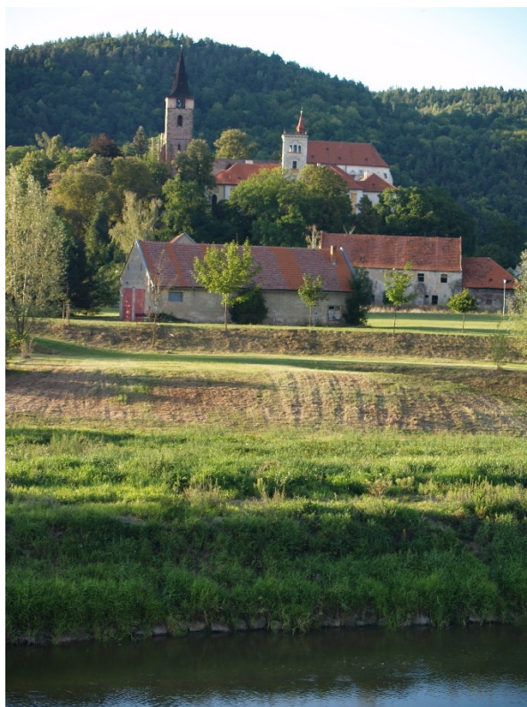
Sázava – bývalý benediktinský klášter, část 11. století se zde sloužila staroslovanská liturgie