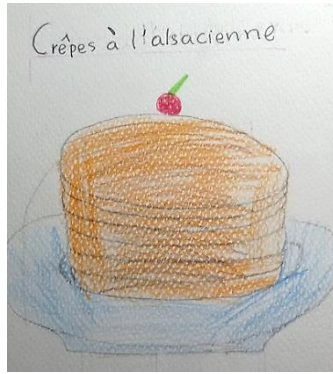
Document 1 – Crêpes à l'alsacienne par une élève de 3 e

Par la suite, les élèves ont répondu à une nouvelle demande de notre part : « Dessine-moi la Chandeleur ! ». Après qu'ils ont compris le sens véhiculé par le dicton « Si point ne veux de blé charbonneux, mange des crêpes à la Chandeleur ! » et après l'avoir appris, les élèves dessinent l'ambiance dans le foyer français le jour de cette fête, par exemple une famille autour de la table, une chandelle tout au milieu et le dicton écrit au-dessus de la table familiale :