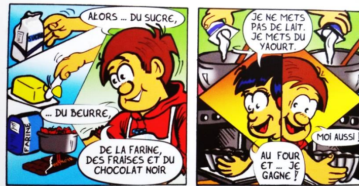
Document 3 – Extrait du livre Les Petites Canailles , Leçon 1, « Master Tri ... Chef », page 12.

Dans le manuel, le « texte déclencheur » nous situe dans un contexte communicatif présentant un répertoire lexical similaire (« du sucre », « du beurre », « de la farine », « du lait ») à celui des ingrédients qui peuvent être utilisés pour la confection de la pâte à crêpes. La lecture nous rend vigilants par rapport à la compétence phonétique et les exemples sont abondants pour l'enseignement de la différence entre « des » et « de ».