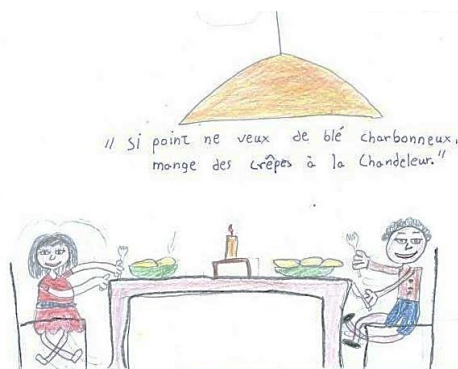
Document 2 – La famille à table le jour de la Chandeleur par un élève de 3 e

Par la suite, les élèves ont répondu à une nouvelle demande de notre part : « Dessine-moi la Chandeleur ! ». Après qu'ils ont compris le sens véhiculé par le dicton « Si point ne veux de blé charbonneux, mange des crêpes à la Chandeleur ! » et après l'avoir appris, les élèves dessinent l'ambiance dans le foyer français le jour de cette fête, par exemple une famille autour de la table, une chandelle tout au milieu et le dicton écrit au-dessus de la table familiale :